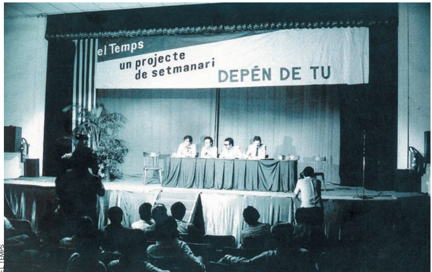
Per a dur endavant el setmanari calien molts suports: abans de sortir a la llum se succeïren els actes com aquest, amb lema explícit: “Depèn de tu”.

Es van decidir a fer, en col·laboració amb Josep Vicent Marquès, des de la Universitat de València, un estudi entre la possible clientela valenciana: per saber-ne les preferències, per escatir quines opcions tenia la revista, per començar a remoure el panorama.