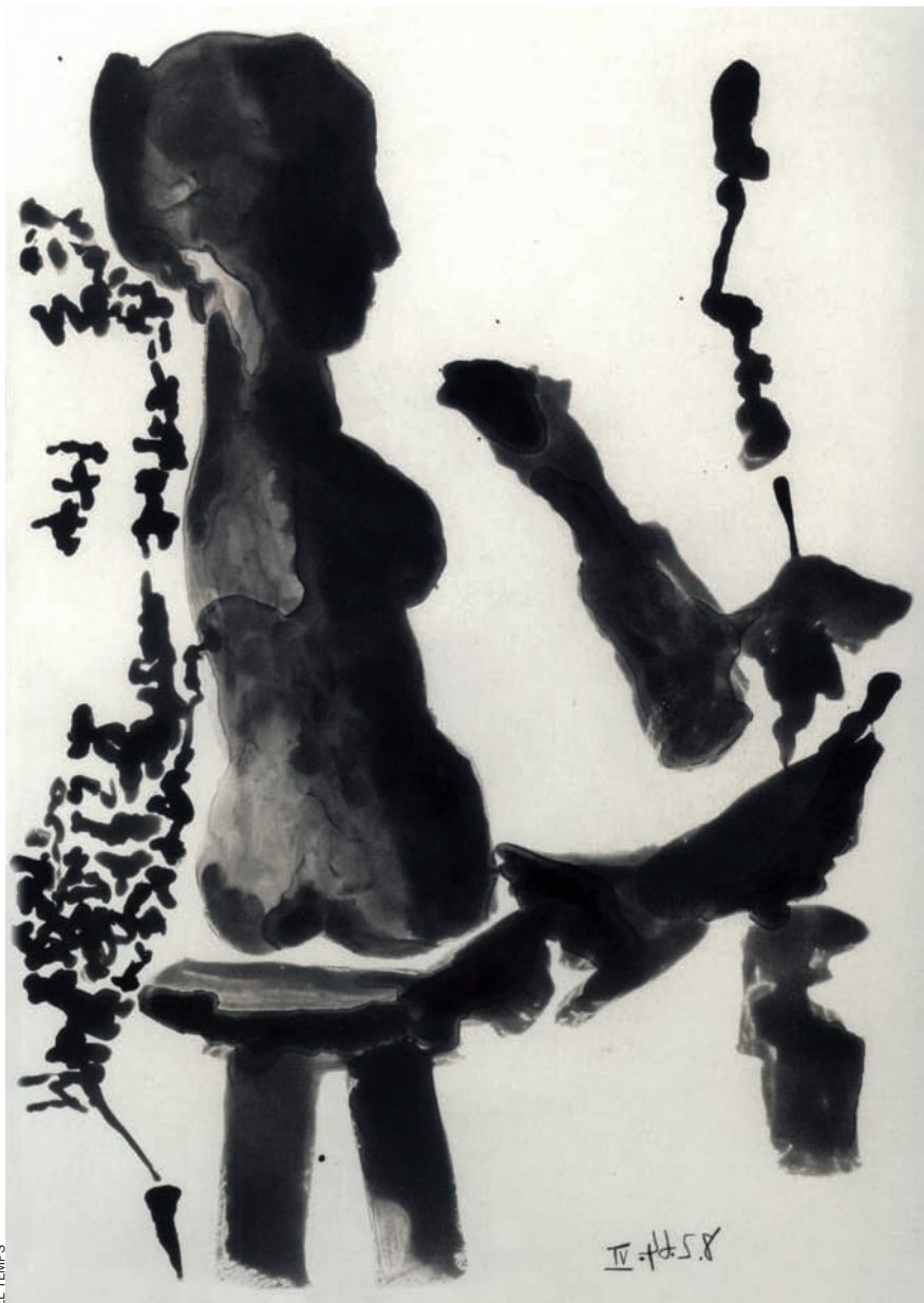
Una obra per a ‘Sable mouvant’, de Pierre Reverdy.

“Le cocu” i Déu. Quan era un jove aprenent al taller parisenc de Roger Lacourrière, Piero Crommelynk va veure com Picasso gravava directament sobre el coure, sense cap dibuix previ, i va trobar, en aquell gest agosarat –i en el resultat– la seva vocació. “Des d’aquell