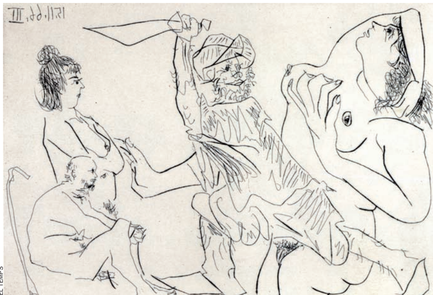
EL TEMPS Il·lustració per a Le cocu magnifique , de Fernand Crommelynck.