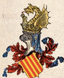
Estendard dels reis de la corona d'Aragó.

"la vista dels quals havem haguda i havem singular alegria i goig, i en aquells moments havem concebuda gran i cor-