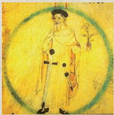
Ramon Borrell, tal i com apareix en un pergami del segle XV.

Jaume, Joan i Margarida, van morir quan eren petits, de manera que Martí va quedar com a únic descendent reial. Per acabar-ho d'adobar, els infants Pere i Martí, els fills que el jove hereu va tenir amb les seves dues esposes, Maria de Sicília i Blanca de Navarra, també