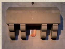
Sepulcre de Guifré el Pelós, al monestir de Ripoll.