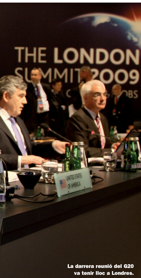
La darrera reunió del G20 va tenir lloc a Londres.

els indicis de recuperació són encara massa febles, el Banc Central Europeu, el Fons Monetari Internacional (llegiu entrevista a la pàgina 75), l'OCDE i els ministres de Finances inviten a no baixar la guàrdia. "Hem de continuar posant en pràctica les mesures de recuperació anunciades per a enguany i per al 2010 i accelerar el sanejament del sector financer per assegurar que els bancs poden prestar en condicions raonables quan les empreses i les famílies reprenen les seues inversions", va dir la setmana passada el comissari d'Economia, Joaquín Almunia.