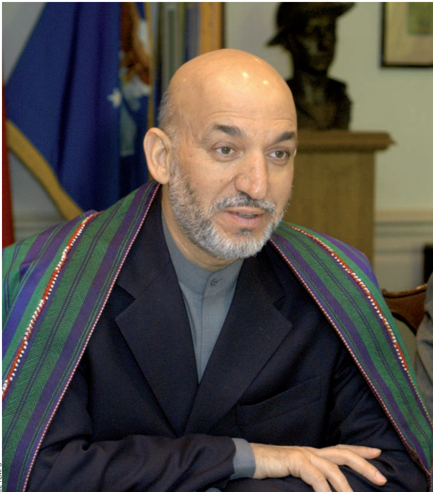
Hamid Karzai ha estat reelegit president de l'Afganistan per la retirada del seu oponent i després d'una primera volta fraudulenta.

—Això pot ser perquè els iranians volen renegociar el tracte amb la seua provada tàctica de retardar. Teniu paciència infinita?