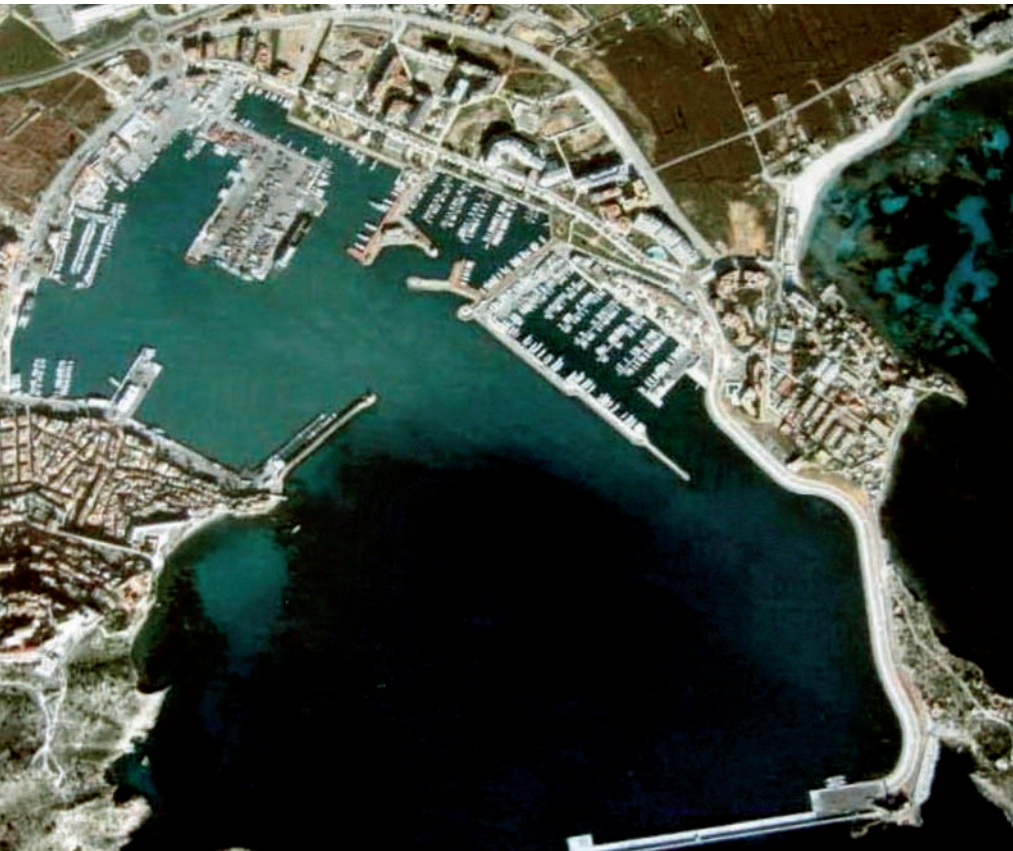
Imatge aèria del port d'Eivissa

ir una nova carretera que travessarà ses Feixes de Talamanca (una zona humida propera que és protegida), tot i que les institucions ho neguen categòricament.