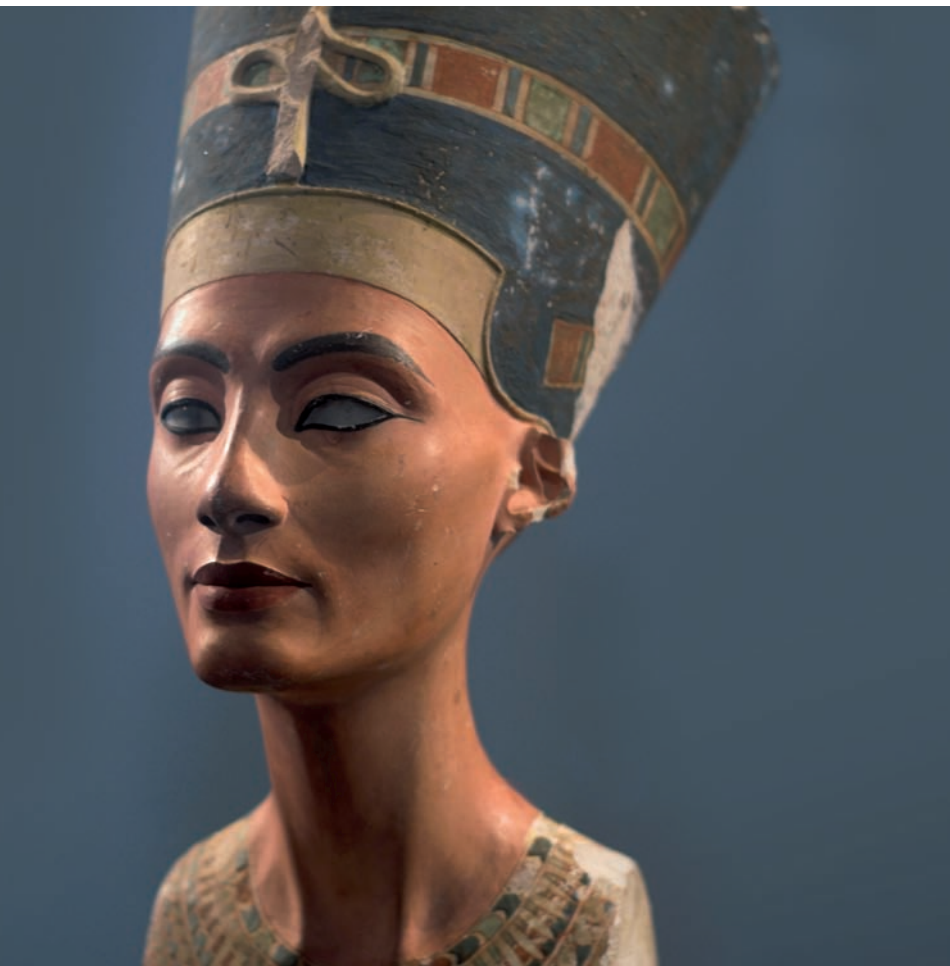
Bust de la reina Nefertiti, guardada al Neues Museum de Berlín.