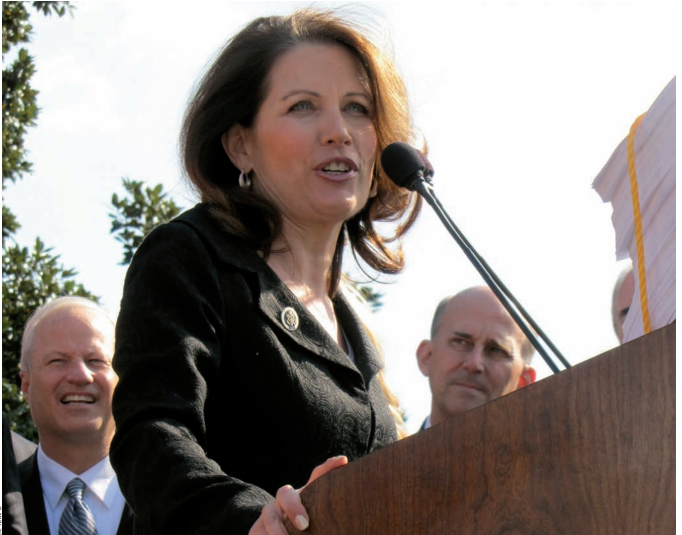
La congressista republicana Michelle Bachmann durant un discurs.