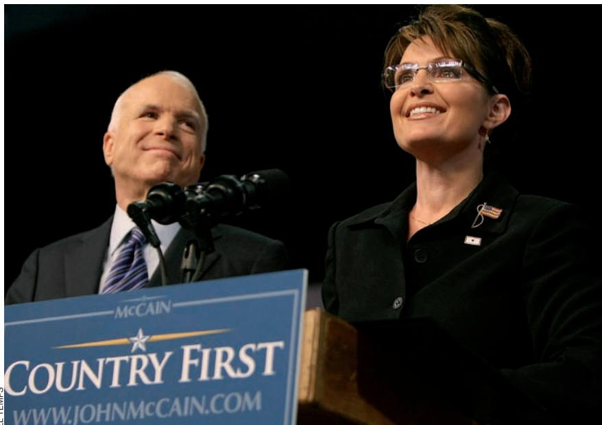
Sarah Palin durant un acte electoral de la campanya presidencial, a Springfield, l'octubre del 2008.

Times . Palin, igual com Bachmann, professa unes idees polítiques purament conservadores, en què es destaca l'oposició al matrimoni homosexual, a l'avortament i a la utilització d'embrions humans per a la recerca. Això no obstant, Palin és partidària de l'educació sexual a les escoles, però amb l'objectiu d'encoratjar l'abstinència. A més, com a membre de l'Associació Nacional del Rifle, és una ferma defensora del dret dels ciutadans a tenir armes de foc. En el terreny ambiental, s'ha mostrat escèptica respecte a les causes que originen el canvi climàtic i, mentre era governadora d'Alaska, va promoure l'exploració de jaciments de gas i petroli en aquell estat, incloses les àrees protegides. Tot i que no té seient al Congrés, els darrers mesos Sarah Palin ha estat una de les veus més crítiques contra el projecte de reforma sanitària impulsat pel president Barack Obama. Una de les seves acusacions, que qualificava la reforma sanitària de "mortal" per a les persones discapacitades, va ser considerada per alguns comentaristes com una de les mentides de l'any.