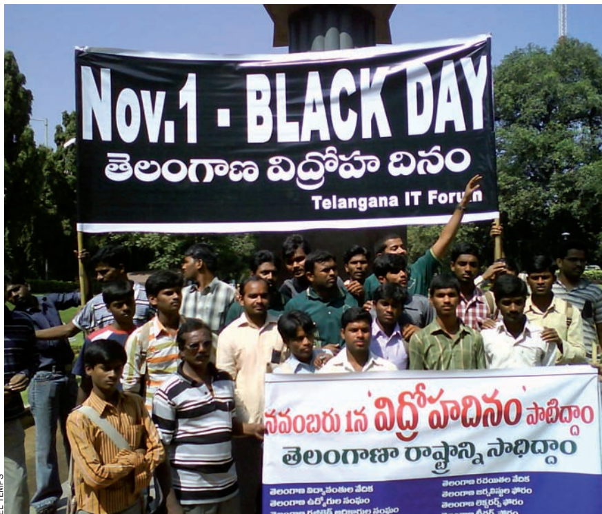
Un grup d'estudiants de la Universitat d'Osmania en una manifestació de suport a l'estat de Telangana.

intenció d'apropriar-se els recursos de Telangana.