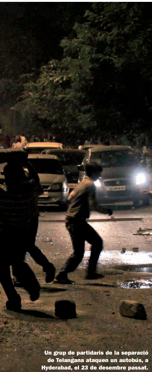
Un grup de partidaris de la separació de Telangana ataquen un autobús, a Hyderabad, el 23 de desembre passat.

B otigues i escoles tancades, milers d'autobusos retirats de la circulació per evitar atacs vandàlics, desenes d'estudiants ferits pels cops de porra de la policia. La Universitat d'Osmania, a la ciutat índia de Hyderabad, ha tornat a ser l'epicentre, igual com fa trenta anys –quan hi hagué centenars de morts–, d'un esclat de violència arran de la disputa per la creació de l'estat de Telangana. Aquesta vegada, les protestes van començar quan un estudiant es llevà la vida com a mostra de suport a aquesta causa. Tanmateix, la polèmica havia començat a desfermar-se el mes de desembre passat, així que el govern de l'Índia, per mitjà del ministre de l'Interior,