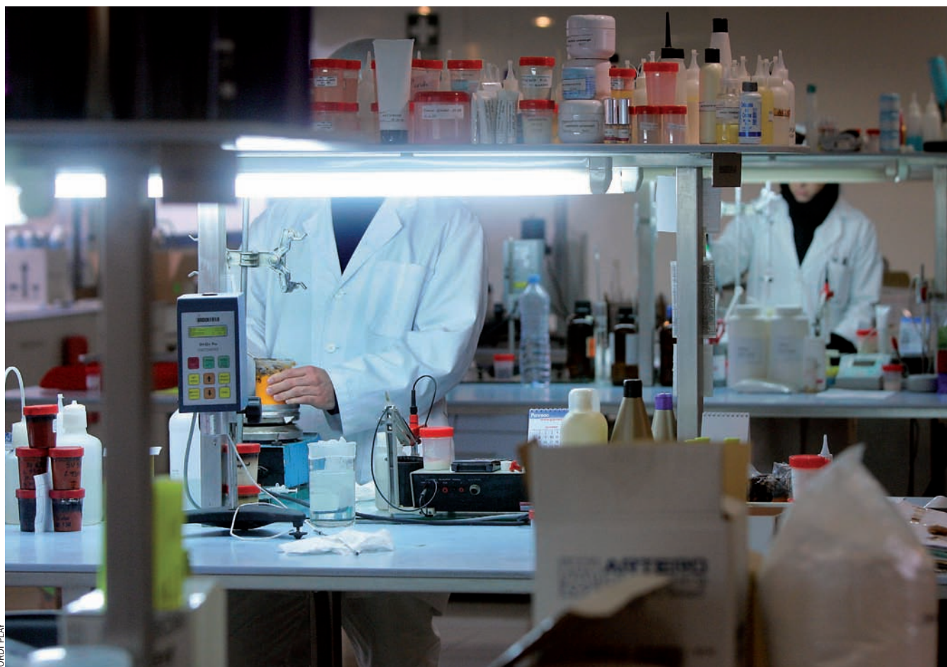
El sector relacionat amb la investigació de nous productes per a la indústria té un gran nombre d'empreses d'alt creixement a Catalunya.