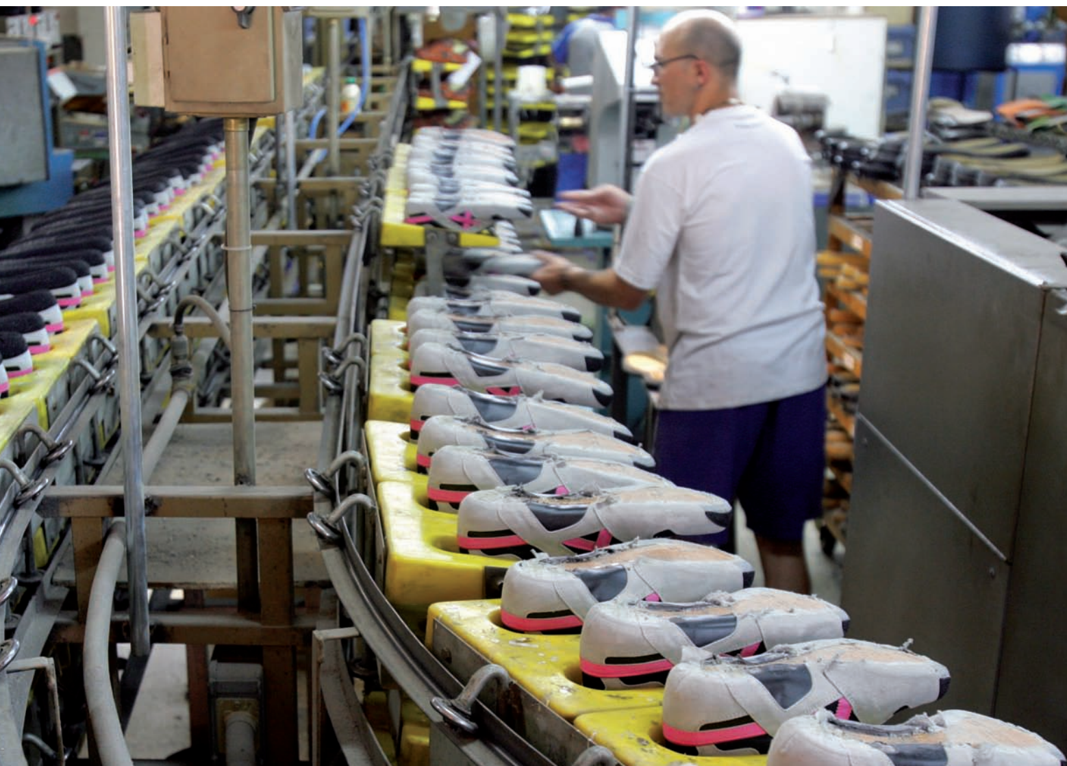
Munich, és una de les 250 empreses d'alt creixement de Catalunya. El 2007 va facturar una mica més de 14 milions d'euros.

Actualment, l'estructura patrimonial de les empreses d'alt creixement és correcta, però, com que treballen amb un nivell d'endeutament elevat per poder assumir les inversions en expansió i innovació, és recomanable que “els anys vinents continuïn potenciant l'autofinançament i les aportacions de capital dels seus accionistes per poder continuar creixent de manera equilibrada, sobretot si es té en compte que són empreses que fan inversions importants en actiu fix”, conclou l'estudi.