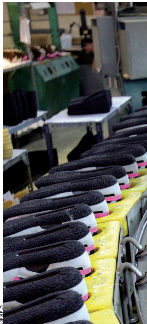
Berneda SA, fabricant del calçat esportiu