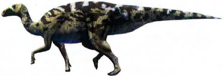
El Pararhabdodon isonensis en una recreació no actualitzada. Ara ha estat identificat com un bec d'ànec, emparentat amb els lambeosaurins d'Àsia i, com ells, hauria de tenir una vistosa cresta.