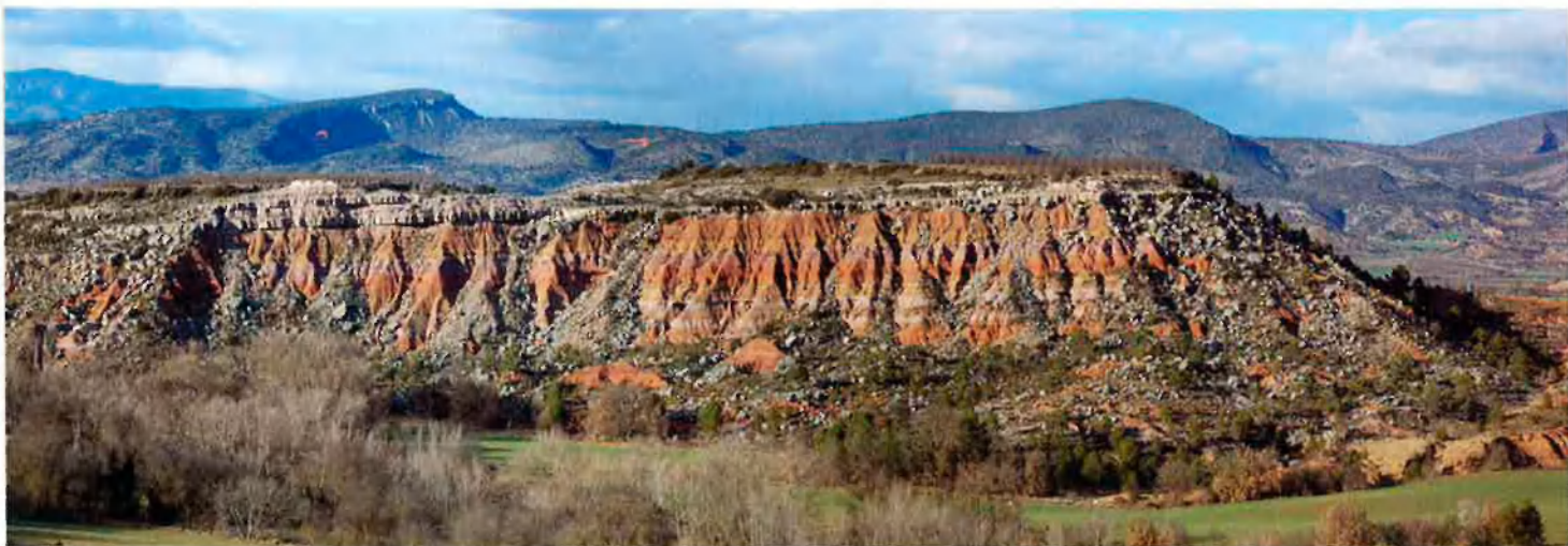
El paisatge de la conca de Tremp permet d'anar a cercar els estrats del cretacl. A la imatge, el pulg Pedrós, al Pallars Jussà.

dels dinosaures de bec d'ànec o lambeosaurins, que tenen una gran diversitat d'espècies, presència arreu del planeta i un gran ventall de crestes com a signe morfològic més característic. Fins ara que la relació entre el Pararhabdodon i els lambeosaurins no ha estat clara, les representacions gràfiques d'aquesta espècie dels Pirineus no li afegien la cresta (vegeu-ne una recreació feta per a Dinosaurios del Levante peninsular fa només dos anys, encara calb, a la pàgina 47).