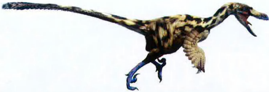
El dromeosaure és un exemple dels teròpodes, els únics dinosaures carnívors del cretaci trobats als Pirineus. Emparentats amb el Velociraptor famós de Parc Juràssic.