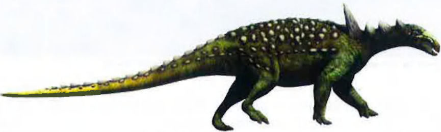
L'Struthosaurus és un exemple dels anquillosaures, amb la pell cuirassada i punxes, però no galre grans: entre el cos i la cua felen dos metres o dos metres i mig, a tot estirar.