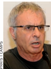
PRENS | CAMPS

Si jo fora Acció Cultural, posaria el PSOE entre l'espasa i la paret, que s'hi pronunciara obertament. Jo, és clar, no tan sols estic a favor de veure TV3 i Catalunya Ràdio, sinó també les televisions d'Indo-xina. Ja veuré allò que em vinga de gust! És el PSOE, que s'hi ha de pronunciar d'una vegada. Així sabrem si tenim una oposició que paga la pena o no.