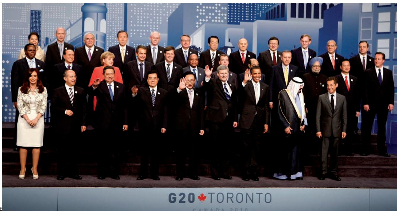
Fotografia conjunta dels participants a la darrera cimera del G20 a Toronto, el dia 27 de gener passat.