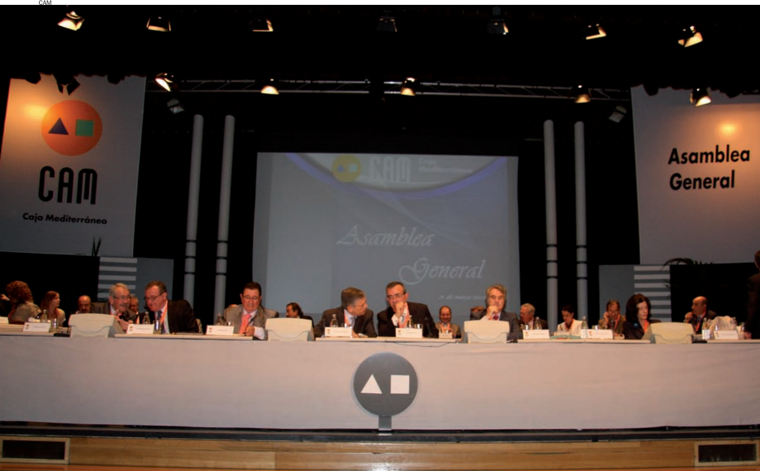
Assemblea general de la CAM, el dia 21 de maig d'enguany, poc abans de signar el protocol d'intencions les quatre caixes que formen el SIP.