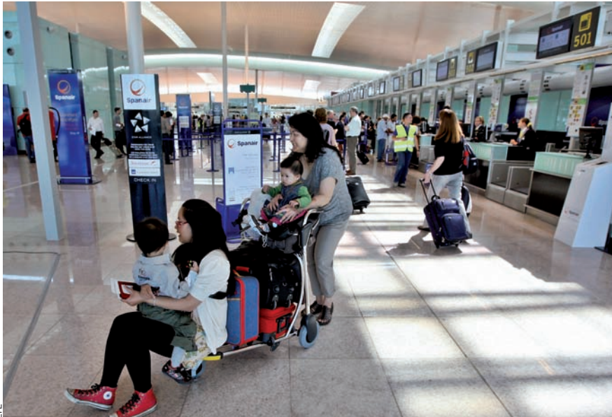
Segons el CCN, Catalunya podria invertir un 12 % del dèficit fiscal actual en la millora de les infraestructures. L'aeroport guanyaria en projecció i, de retruc, l'economia catalana creixeria.

propi català faria que els jubliats catalans cobressin unes pensions raonablement més elevades de les que perceben ara. L'explicació és que Catalunya genera més ingressos a la Seguretat Social que la resta de l'estat per la seva més alta taxa d'ocupació i per la seva major cotització mitjana. El fet que la pensió mitjana no reflecteixi la major productivitat de l'economia catalana provoca que aquestes pensions siguin inferiors a les que s'obtidrien amb un sistema propi de Seguretat Social.