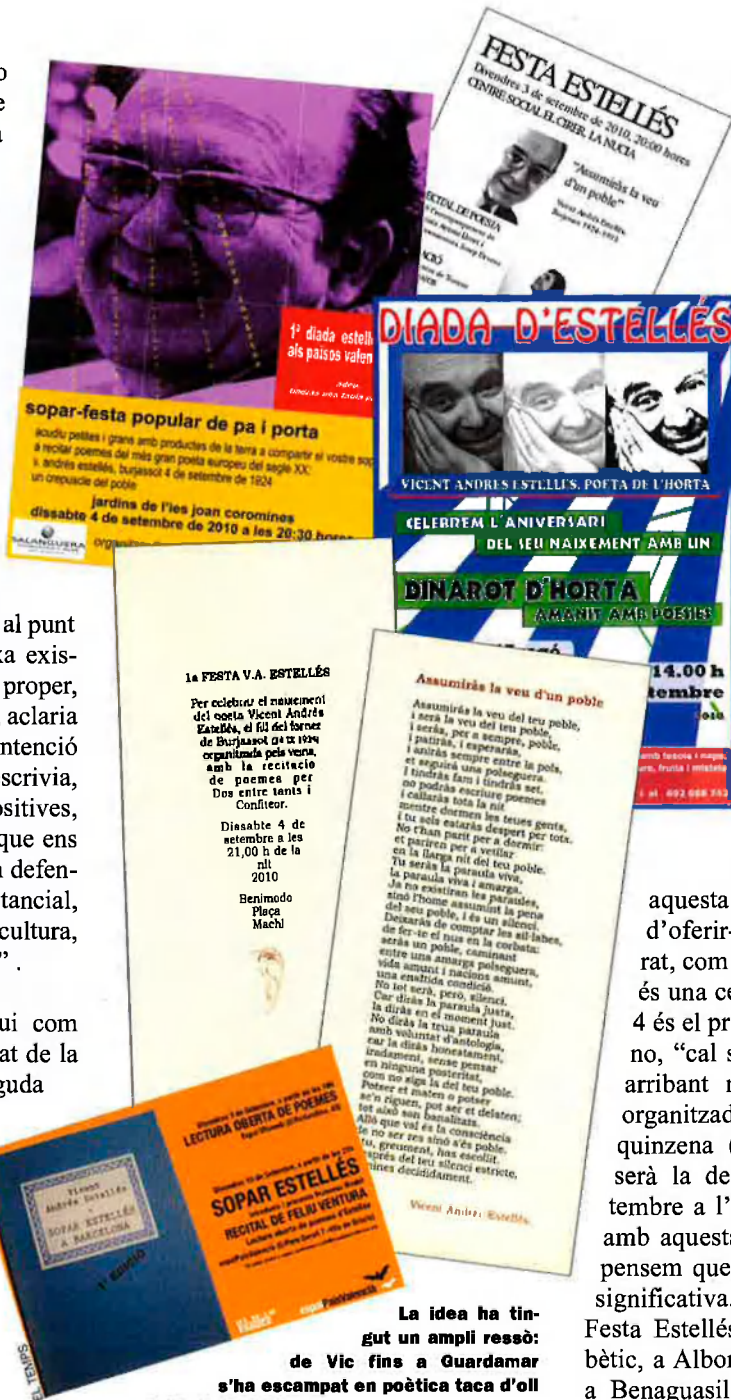
La idea ha tingut un ampli ressò: de Vic fins a Guardamar s'ha escampat en poètica taca d'oli la Festa Estellés.