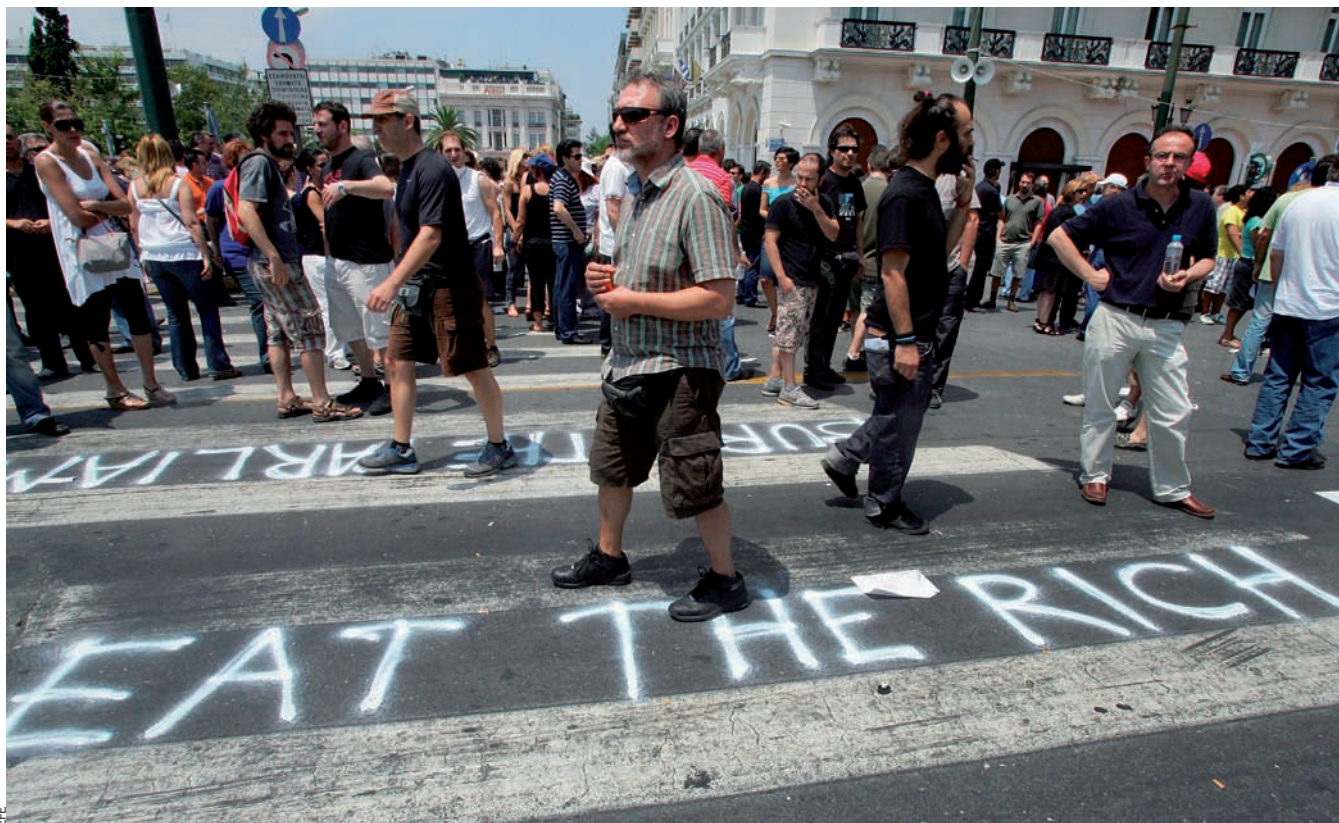
“Menja’t els rics”, diu una pintada davant el parlament grec, el dia 8 de juliol, a la setena vaga general per la reforma del sistema de pensions.

països nòrdics la taxa d’afiliació als sindicats supera el 80%, una força de representativitat social que els dóna un gran poder enfront de les patronals i els governs.