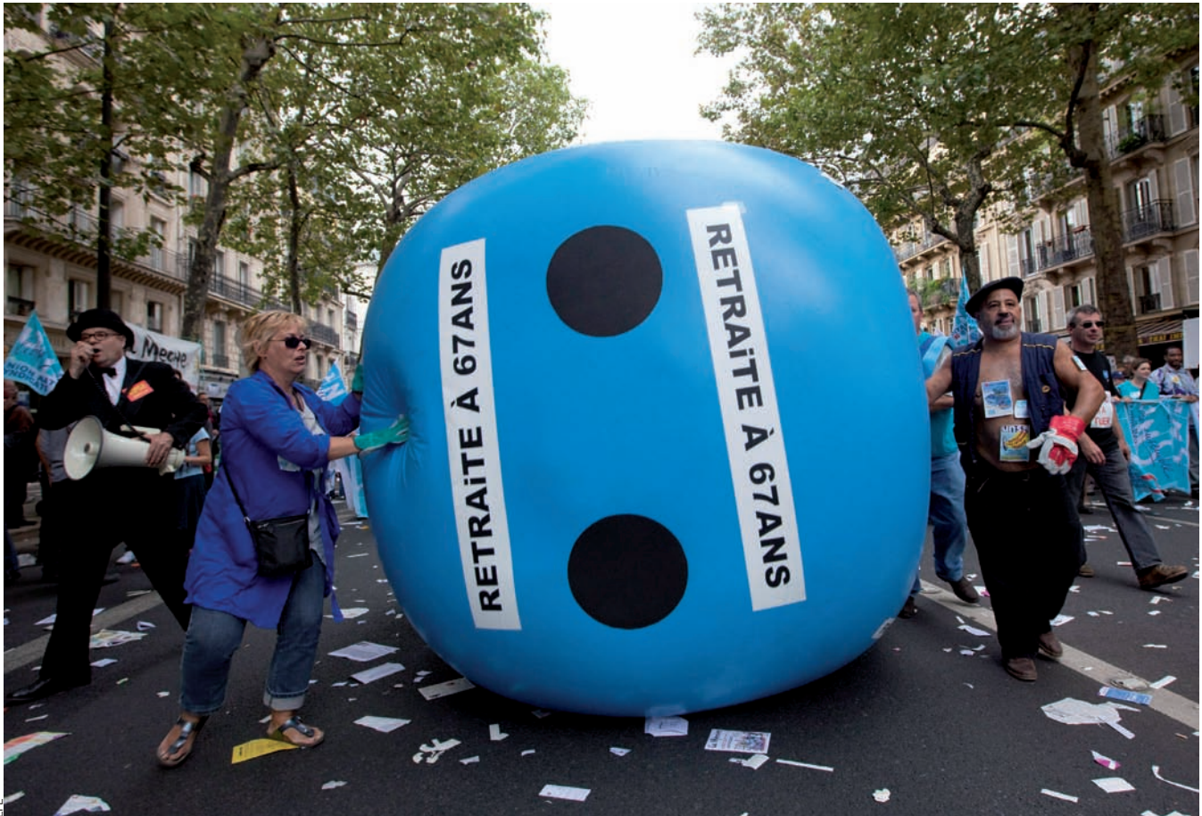
Un milió de treballadors es manifestaven a París contra la reforma del sistema de pensions que prepara l'executiu de Sarkozy, el 7 de setembre passat.

malgrat que la baixa taxa d'afiliació que hi ha els fa extremadament dependents de l'aportació pública. Les xifres oficials sobre conflictivitat i afiliació porten a pensar que la bel·ligerància o no dels sindicats depèn més de qüestions estratègiques a cada empresa i a cada sector i de la cultura laboral de cada país que no pas del color del partit que governi o del grau de dependència de les subvencions públiques.