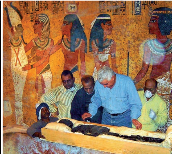
Ara com ara, Hawass ha tingut poc èxit convencent els museus estrangers perquè retornen les obres egípcies. Hawass comprova l'estat de la mòmia de 3.300 anys d'antiguitat que fou el rei Tutankamon, dins la seua tomba.

en blanc i negre, però Hawass, impertèrrit, es va permetre de comentar: “Això que hem vist aquesta nit és completament insòlit en el món de l’egiptologia.” Vet aquí l’autèntic do d’aquest home: la capacitat d’entreteixir somnis i història. Omar Sharif qualifica el seu amic d’“actor increïble”.