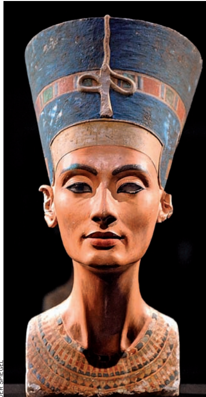
Bust de Nefertiti, de la dinastia XVIII d'Egipte, esposa reial d'Akhenaton.

Potser el director d'antiguitats vol portar les coses massa lluny? Està disposat a cursar demandes concretes o el seu interès es limita a intimidar