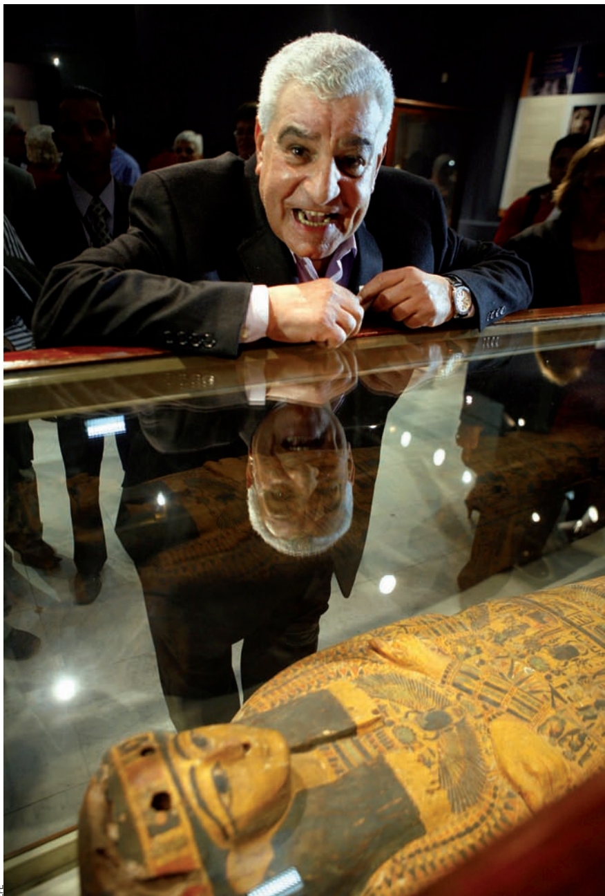
Zahi Hawass, al costat del sarcòfag conegut amb el nom de Fèretre Miami, que fou robat d'Egipte i, fa poc, retornat des dels Estats Units.

Al Louvre també els ha ensenyat les dents. Hawass volia que el museu francès els tornés cinc magnífics