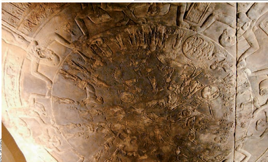
Hawass reclama la pedra de Rosetta i més peces: una imatge de Ramsès II –actualment a Torí, Itàlia– i un relleu astrològic amb una representació del zodíac –que és al Louvre de París.

el soldà d'Istanbul també contribuïa al govern del país.