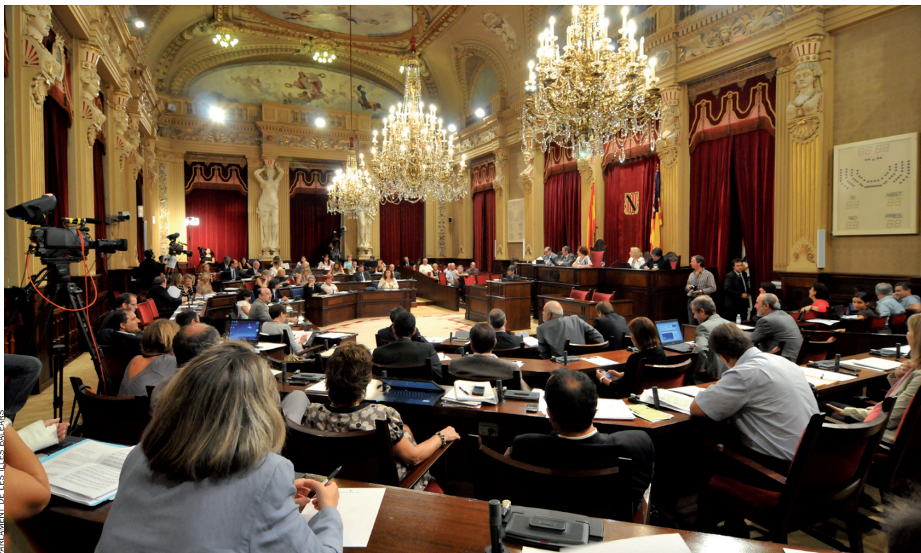
PARLAMENT DE LES ILLES BALEARS

La polèmica. El ministre Blanco es limità a anunciar aquest "remodelatge", però sense especificar detalls de com seria. Tot d'una s'aixecaren les alarmes a les Balears. El senador autonòmic Pere Sampol (PSM) demanà al ministre, durant una sessió al Senat, que rectificàs la intenció anunciada, però Blanco s'hi mantingué ferm sense, tanmateix, concretar com seria la reforma del sistema. La bolla de la irritació a les Illes s'anà fent grossa. Tots els partits s'hi van anar mostrant radicalment contraris. Fins i tot el secretari general del PSOE balear i president del govern,