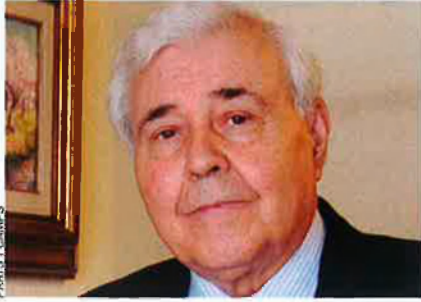
FRATIS I CAMPS