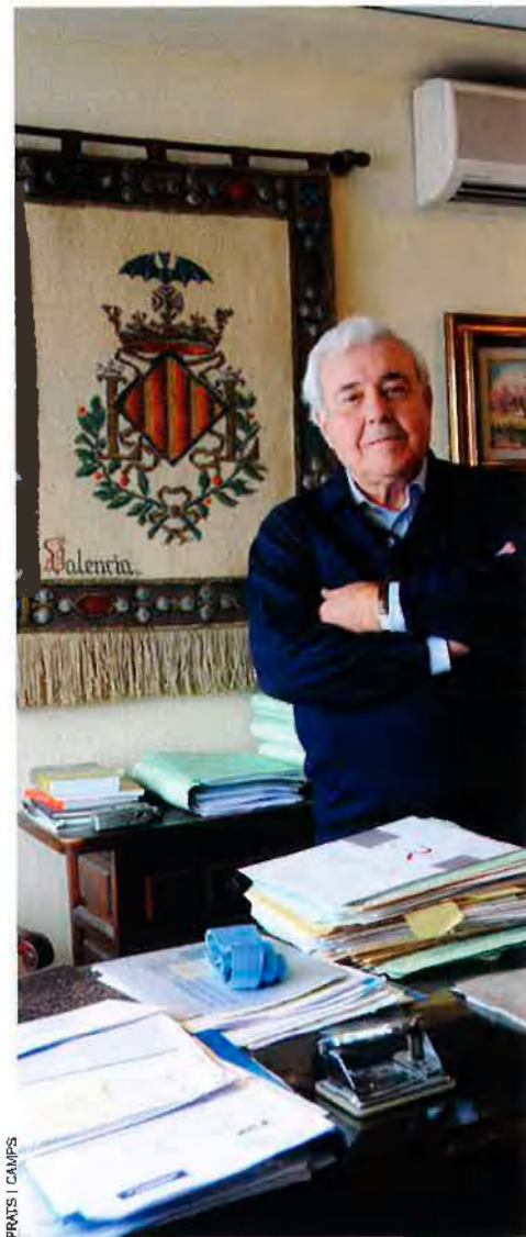
PRATS | CAMPS