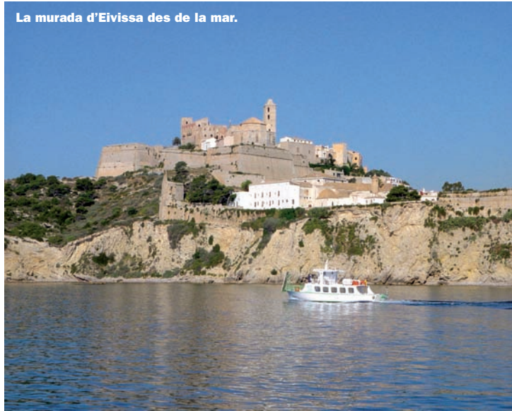
La murada d'Eivissa des de la mar.