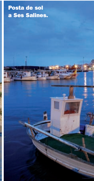
Posta de sol a Ses Salines.