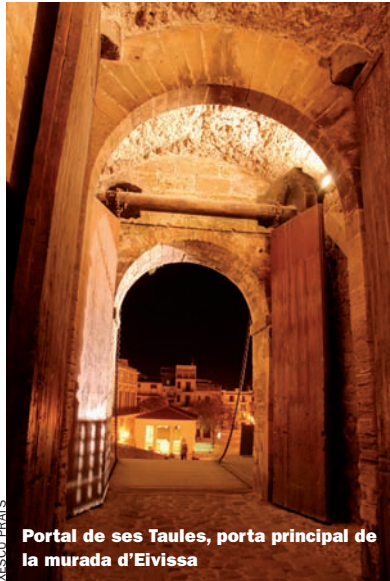
Portal de ses Taules, porta principal de la murada d'Eivissa