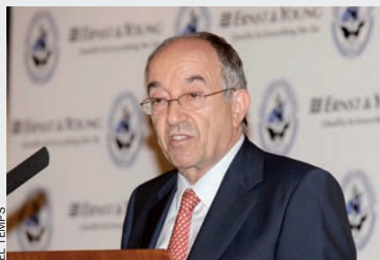
Irlanda ha contagià el deute espanyol, que assoleix el risc més elevat des del 1996.

La crisi irlandesa ha desembocat en la intervenció de la UE per a rescatar l'economia del país, i ja ha tingut un efecte dòmino en la solvència del deute públic de més estats europeus, entre els quals l'espanyol, que ha arribat a la màxima qualificació de risc des de l'any 1996. El governador del Banc d'Espanya, Miguel Ángel Fernández Ordóñez, ha demanat que s'accelerïn les reformes estructurals pendents, principalment en el sistema de pensions i els nivells d'endeutaments permessos a les comunitats autònomes. D'una altra banda, Irlanda reduirà el salari mínim inter-