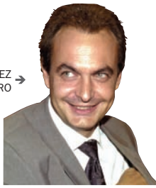
RODRÍGUEZ ZAPATERO →

MARÇ DEL 2004 Zapatero guanya els comicis estatals i el PSPV obté un suport del 43%, només comparable amb els resultats dels anys 80. Els valencians Pedro Solbes i Teresa Fernández de la Vega –amb un pes orgànic nul, això sí– esdevenen els dos vice-presidents del lleonès, mentre Jordi Sevilla assumeix la cartera d'Administracions Públiques, i Leire Pajín, la secretària d'estat de cooperació.