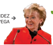
FERNÁNDEZ DE LA VEGA →

MARÇ DEL 2008 Tres membres del govern espanyol amb ínfima ascendència al si del PSPV lideren les llistes al Congrés del 2008. Bernat Sorria, Teresa Fernández de la Vega i Jordi Sevilla es presenten per Alacant, València i Castelló, respectivament. Els socialistes tan sols perden dos punts respecte al 2004.