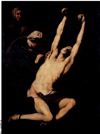
Sant Sebastià atès per la devota Irene, de Josep de Ribera, uns de les peces del museu.

Efectivament, des del seu pas per aquell ministeri, a final dels 90, la famosa cinquena fase de remodelatge ha viscut una gimcana administrativa que ha deixat l'edifici noble en la lamentable situació en què es troba ara. Carme Alborch, que l'havia precedida al càrrec al darrer govern de Felipe González, havia deixat preparades i pressupostades les obres (1.200 milions de pessetes, uns 7,2 milions d'euros). Però Aguirre va dir que no. Formalment (premonitòriament?), que no li agradava la proposta arquitectònica per a l'anomenada sala Laporta , per bé que sembla