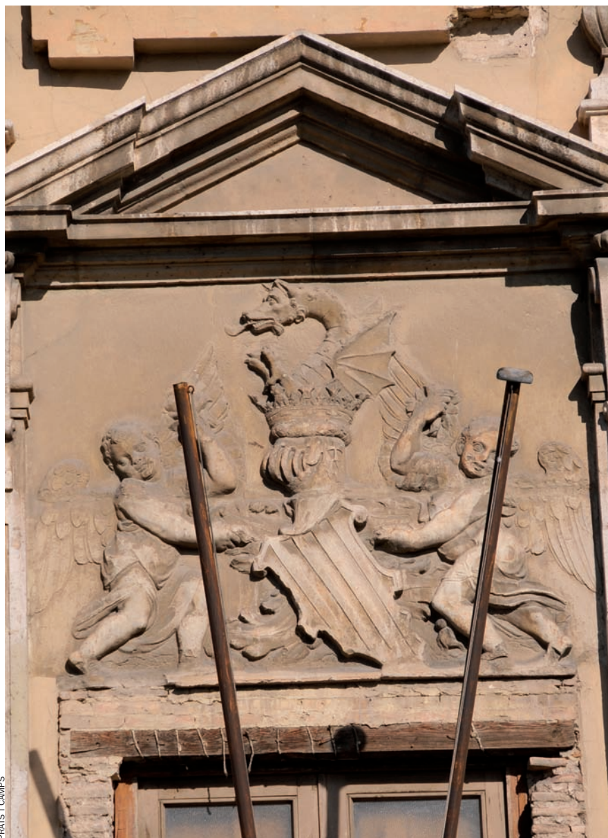
Detall de la façana de l’edifici antic del Museu de Belles Arts: el deteriorament es fa palès també (i especialment) en els símbols.

Fa més d’un any que no té director. Hi ha hagut goteres i xilòfags, despreniments i retauls fets malbé. Generalitat i govern estatal s’espolsen mútuament les puces i juguen al ball de bastons. Mentrestant, el Museu de Belles Arts Sant Pius V, de València, escandalosament, llangueix.