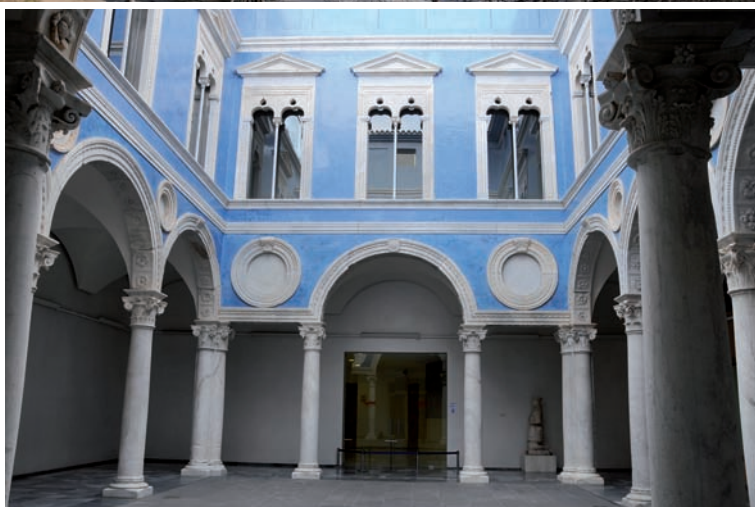
serven la Mare de Déu de la Llet, d'Antoni Peris, documentat a València entre 1393 i 1423), part de la torre enxarxada, una sala del vell edifici vista des del claustre, detall de l'estat de la façana i el pati de l'ambaixador Vic.

a allargar-ne l'abast), una consignació d'1,5 milions als pressupostos de l'estat. No sembla, per tant, que hi hagi manera que vagin endavant. Però el cas és també que, de fet, qui va aturar el desenvolupament d'aquesta cinquena