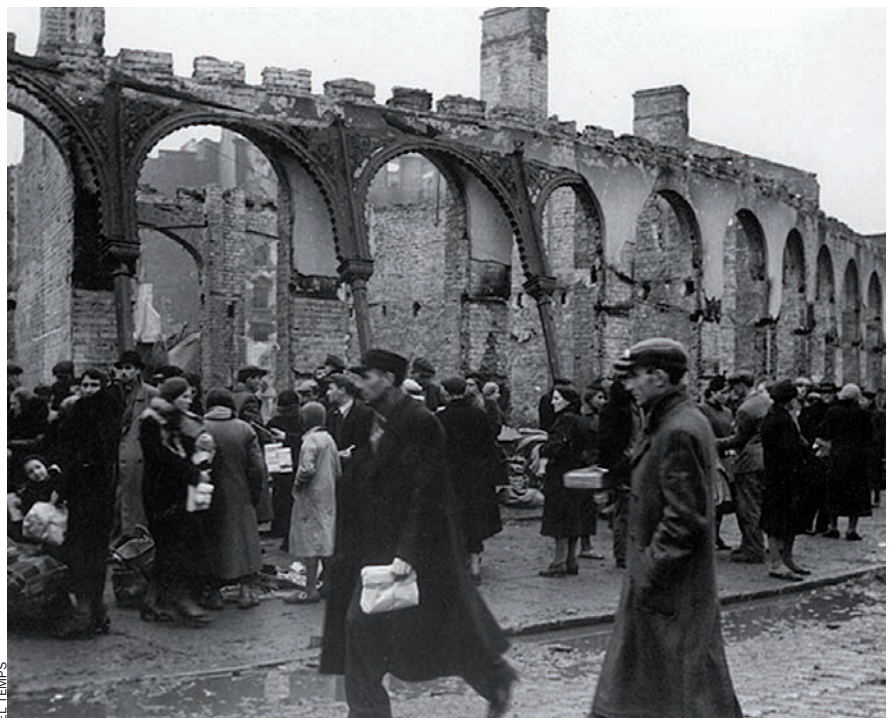
Els jueus internats al gueto de Varsòvia van informar Jan Karski, el 1942, del pla d'extermini total que havien començat a aplicar els nazis.

Però, de mica en mica, el llibre i el personatge, tot i ser un heroi que