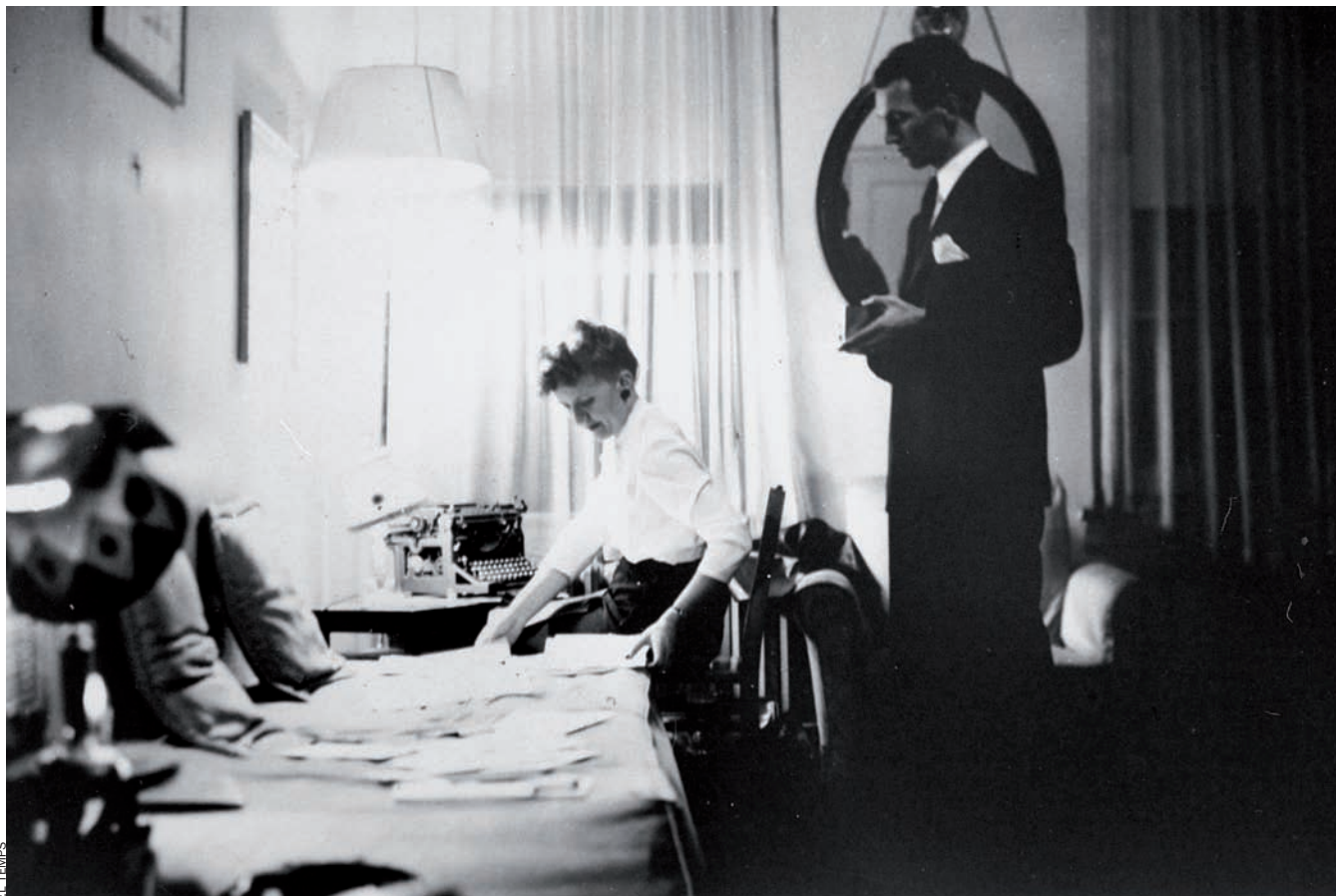
El diplomàtic polonès dicta el seu llibre Història d'un estat clandestí a una secretària i traductora, a l'habitació d'un hotel de Manhattan, a Nova York, l'estiu del 1944.

hauria pogut enllaminar un productor de Hollywood –va escapar-se de l'Europa nazi, a través de Gibraltar, després d'accedir-hi des de Perpinyà, via Barcelona–, van caure en l'oblit. Hi va influir un fet polític de forta transcendència per a l'estat polonès i per a Europa.