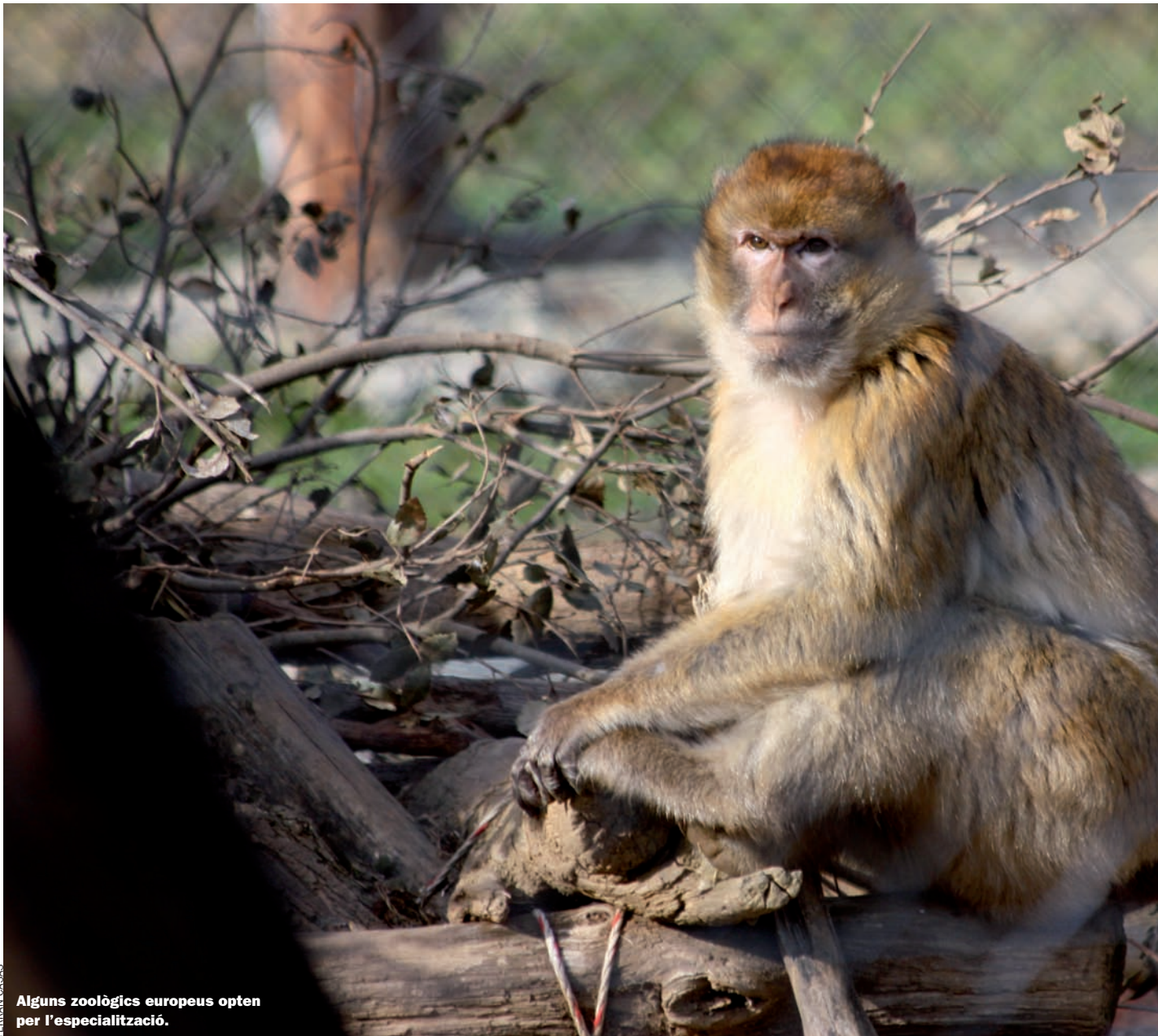
FERRAN CASAS Alguns zoològics europeus opten per l'especialització.

F a menys d'un mes, la sobtada i precoç mort del Knut, el jove ós polar del zoo de Berlín, va començar a preocupar tots els berlinesos. Knut havia nascut l'any 2006 juntament amb el seu germà bessó al zoo de Berlín. Dissortadament, la mare va rebutjar el nou-nascut, que va ser adoptat per l'opinió pública com un Floquet de Neu a la