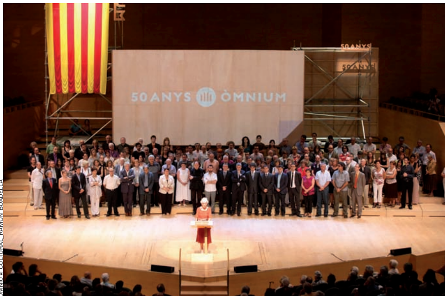
ÒMNIUM CULTURAL - RAMON BOADELLA