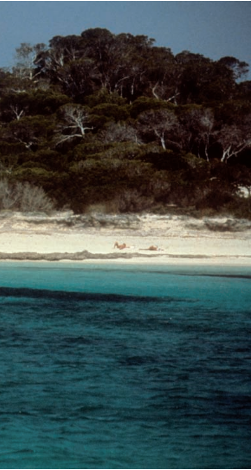
i serví per a salvar aquell paratge.

na el vist-i-plau a la urbanització. Els primers mesos del 1977 es manté viva la polèmica a la premsa, i el debat públic és alimentat gràcies a les organitzacions esmentades, que fan conferències i actes diversos contra el malmetement de l'illot.