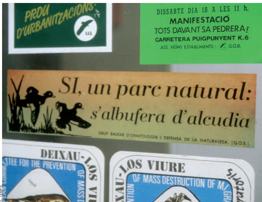
EL 1976 el Grup Ornitològic Balear va començar a recollir signatures per a protegir s'Albufera d'Alcúdia. Finalment, fou salvada i declarada parc natural.

Primers ecologistes. A final de la dècada dels 60 i principi de la dels 70, en ambients socials minoritaris es comença a debatre, en resposta a la balearització, el perill que implica el ferotge procés de construcció totalment esgavellat. A la primera meitat de la dècada dels 70 —amb la dictadura de Franco encara vigent i que cobria legalment qualsevol animalada urbanística—, aquests grups difusos de persones que eren excursionistes, estudiants i professors de geografia i biologia, juntament amb intel·lectuals i periodistes, comencen a escriure a