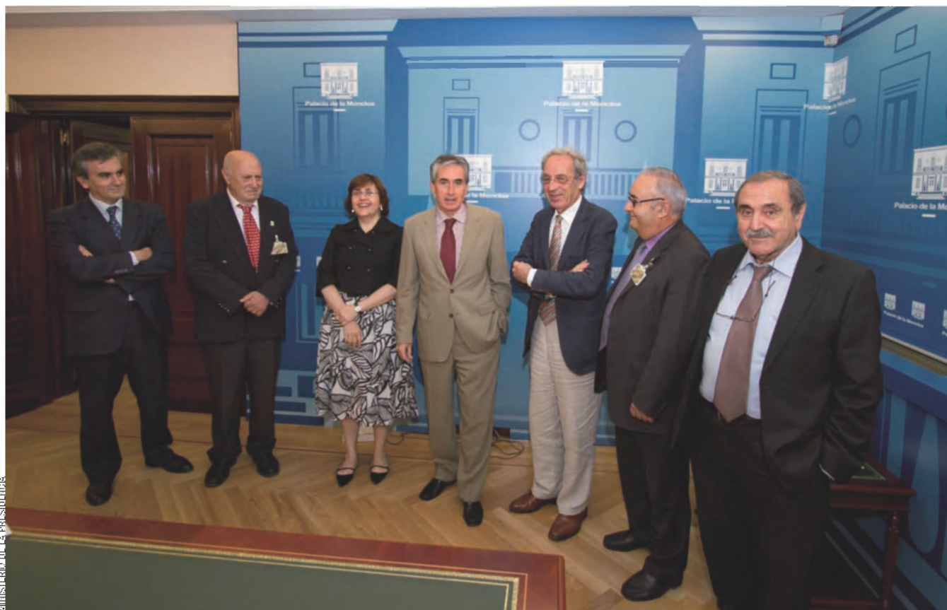
MINISTERIO DE LA PRESIDENCIA

Reunió de la delegació d'ACPV i dels presidents de les acadèmies basca, gallega i catalana amb el ministre espanyol de la Presidència, Ramón Jauregui. La trobada, el propassat 6 de juliol, va significar el vist-i-plau definitiu a la presa en consideració de la ILP "Televisió sense fronteres".