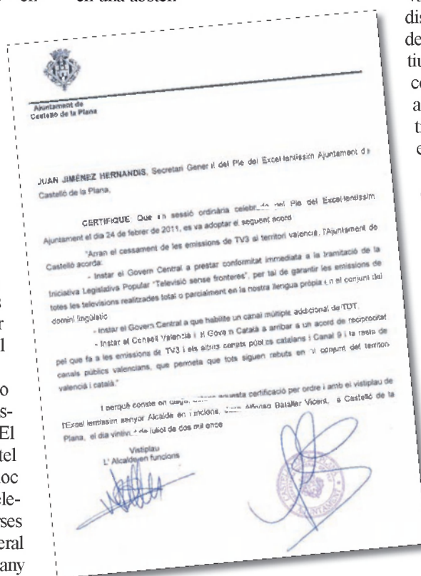
Moció aprovada per unanimitat l'Ajuntament de Castelló, quan Fabra encara n'era alcalde.

A més, el govern de Zapatero ha insistit que el País Valencià es troba en condi-