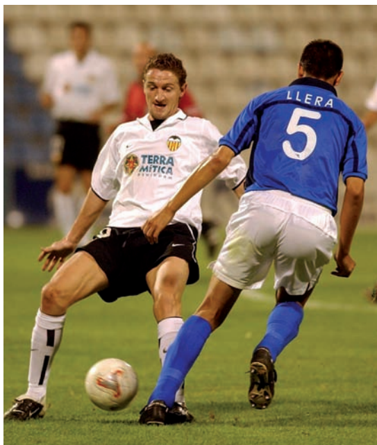
del Rei contra el Barça, el Vila-real i el València. En l'últim cas, l'equip de la capital fou eliminat.

proporcionat l'estructura i les places de competició de què disposava. El pressupost global de l'Sporting és tan escàs que fa feradat: 60.000 euros. Com que és un nou club, no pot accedir a cap subvenció municipal. En canvi, confien a tancar un patrocini privat de la samarreta.