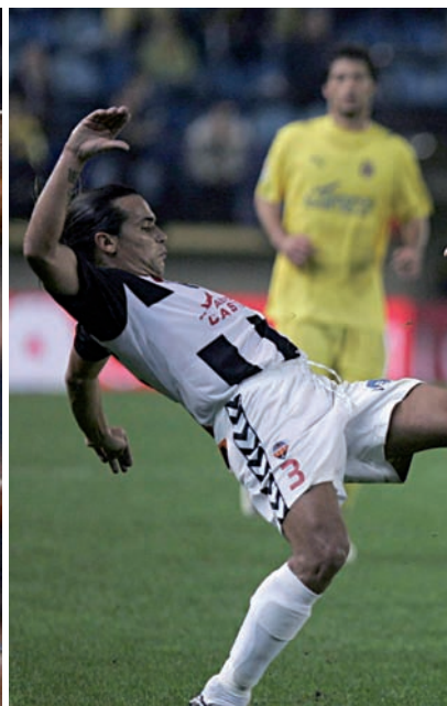
No fa gaire temps, el Benidorm, el Castelló i l'Alacant posaven contra les cordes els equips grans. D'esquerra a dreta, respectivament, partits de Copa

E l Barça de les sis copes, l'equip que entre el 2008 i el 2009 va enamorar el món pel seu futbol efectiu i precisió, amanit de golejades als rivals, va patir de valent als dos partits que en principi semblaven més assequibles. El Benidorm CF, un equip modest que del grup tercer de la segona divisió B, tan sols va perdre d'un gol (0-1) a l'estadi de Foietes i al Camp Nou (1-0). Fins que al minut 87 del partit de tornada Leo Messi no va aprofitar el rebuig d'un penal que ell mateix acabava de malbaratar, que la culerada no va veure clara la classificació als vuitens de final de la Copa del Rei. De tot allò no fa ni tres anys, però el Benidorm CF ja no existeix.