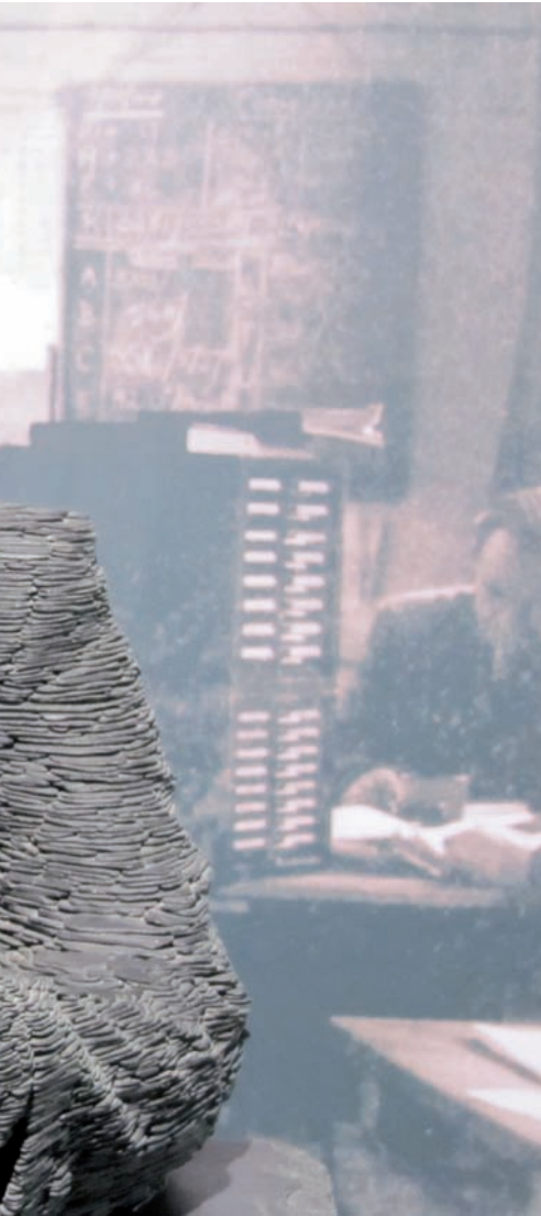
ara hi ha aquesta estàtua de pissarra.

salutació de l'autor" i la petició que disculpés la taca de la portada, perquè "és el darrer exemplar que en tinc".