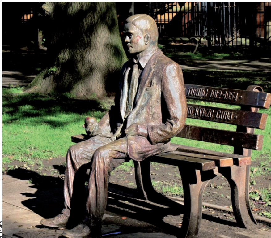
Alan Turing té un memorial al Sackville Park, a Manchester.

Va ser transcendental la seva contribució al trencament de les cada vegada més sofisticades versions de la màquina electromagnètica Enigma, amb la qual els alemanys xifraven i desxifraven missatges. Des que, el 1929, el matemàtic polonès Marian Rejewski havia encetat el camp per a anar descodificant Enigma, s'havia viscut una escalada d'encryptació i descriptació que també van experimentar les màquines anti-Enigma o bombes (de bomba kryptologiczna , nom que sembla que van prendre els matemàtics polonesos d'unes seves postres predilectes). Poc temps després d'arribar a les instal·lacions de la GCCS a Bletchley Park, Alan Turing, amb la col·laboració del matemàtic Gordon Welchman, ja havia dissenyat una bomba veritablement efectiva, i ràpida, sobre la base d'un teorema lògic que estableix que, a partir d'una contradicció, ho pots deduir tot. El