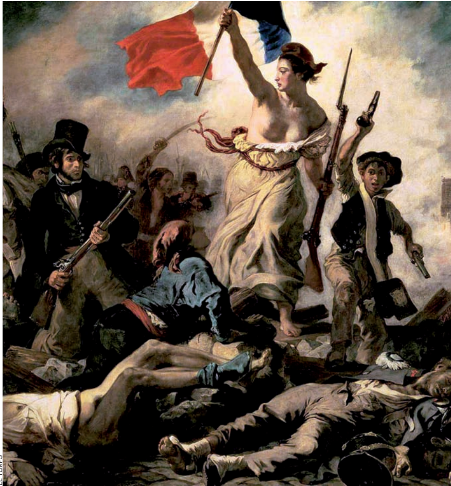
La llibertat guiant el poble, una idealització pintada per Eugène Delacroix el 1830.

—L'ús metafòric i simbòlic de la dona i del seu cos passa a un àmbit punyent quan esdevé camp de batalla polític.