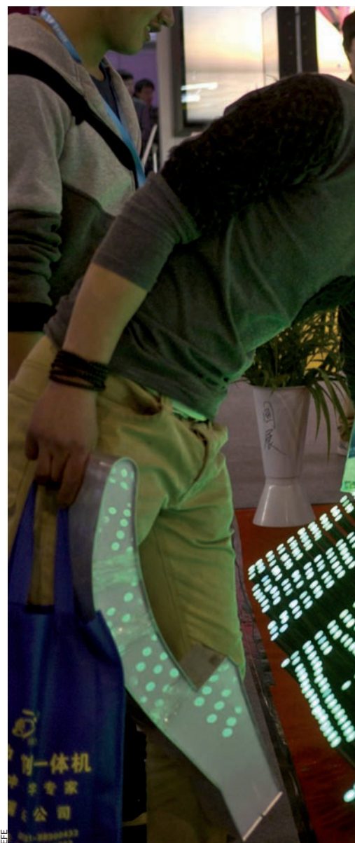
El pla quinquennal de la Xina preveu que la

Conflicte social. Un dels màxims desafiaments que ha d'afrontar la Xina és el conflicte social latent en una societat desigual. Ara mateix, la Xina viu dues menes de conflictes interns: el primer és ètnic i se situa a la província de Xinjiang; el segon és el contenciós amb el Tibet. A Xinjiang, diversos grups ètnics han ocupat el carrer en disputa amb el govern xinès, que acusen d'abandonar aquesta província de l'est, allunyada del nucli de decisions. Tant aquest conflicte com el