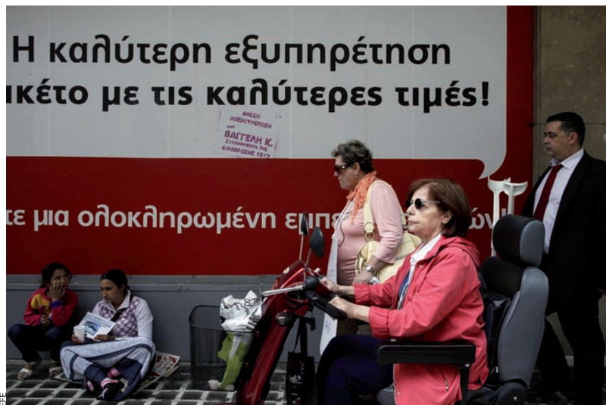
Unes dones pidolen als carrers d'Atenes.