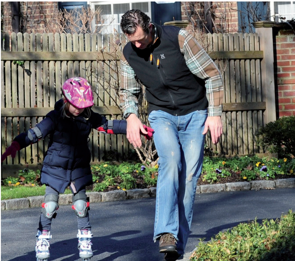
Mentrestant es va escampant el rumor d'un possible "allunyament" progressiu entre la filla de Joan Carles I i Urdangarin.

digué el monarca per la televisió el 24 de desembre passat, hi havia l'expressa voluntat que el seu gendre pagués allò que pogués haver fet. Però alhora Joan Carles I devia ser conscient que la monarquia tindria una via d'aigua molt important si la filla hi fos encausada per delictes penals. Recordem que els qui encausen Urdangarin podrien –si fos jutjat i condemnat– portar-lo a la presó per un màxim de divuit anys. És difícil d'imaginar que una filla del rei s'enfrontés a una pena semblant.