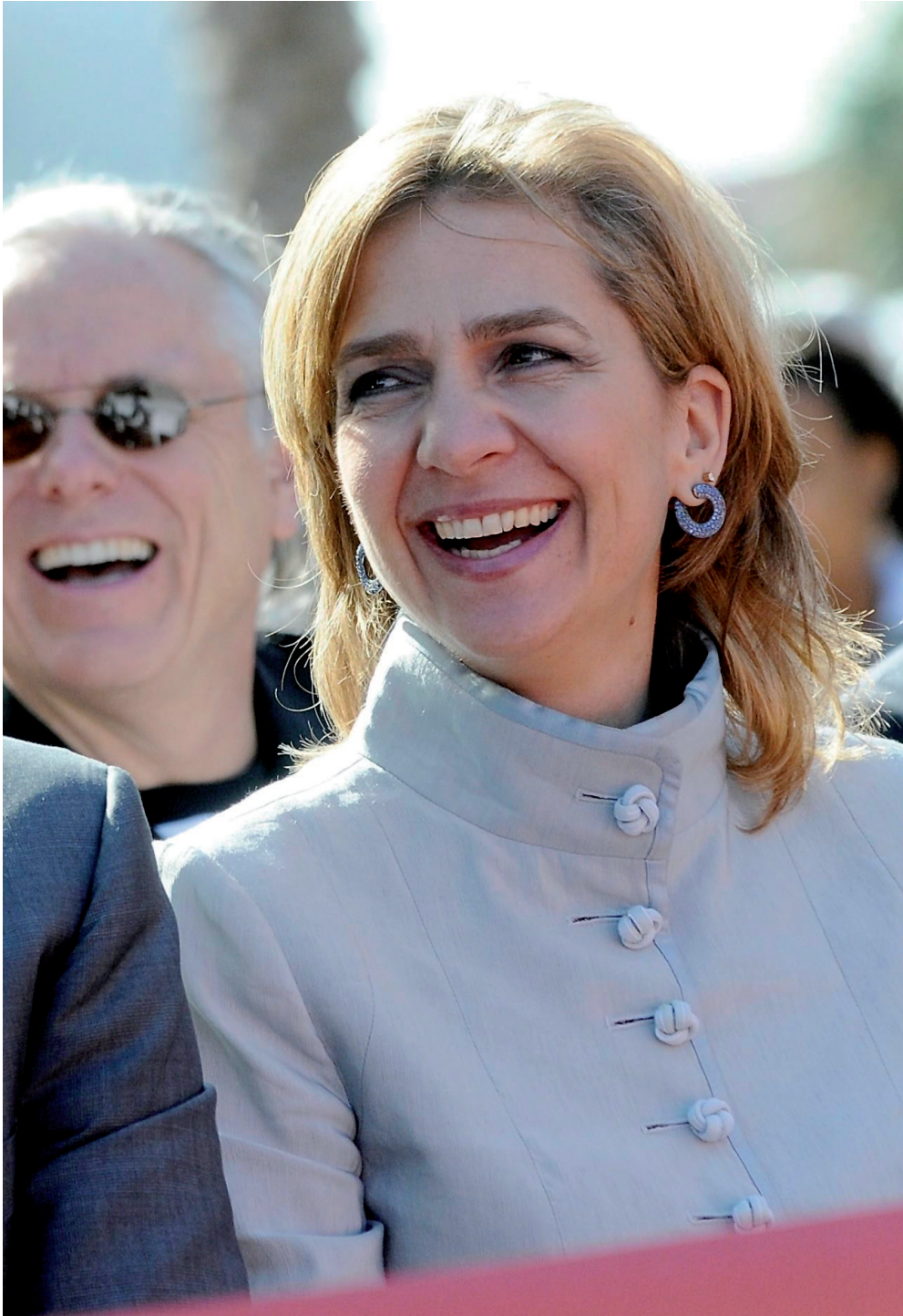
i que va rebre més de 12.000 euros de l'empresa investigada, l'institut Nóos.

judicials d'Urdangarin, i fins i tot a les columnes i publicacions del cor –i a les tertúlies televisives de la mateixa branca– es parla obertament de les conseqüències familiars que té –i que pot tenir– l'afer.