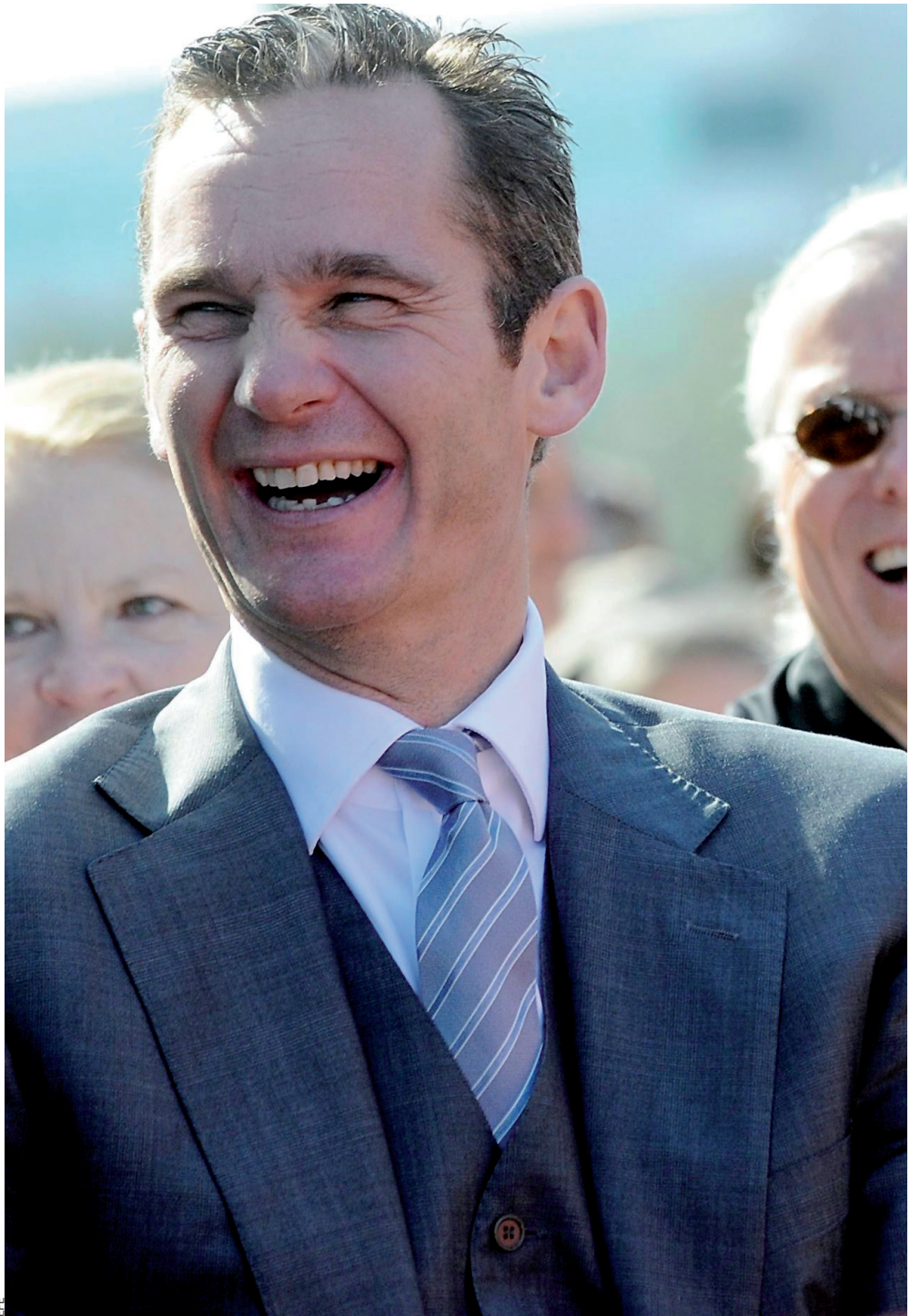
La infanta Cristina de Borbó no ha estat encausada ni haurà de declarar en el cas Urdangarin , tot

Ara tot és diferent. Avui tots els diaris publiquen el dia a dia de les vicissituds