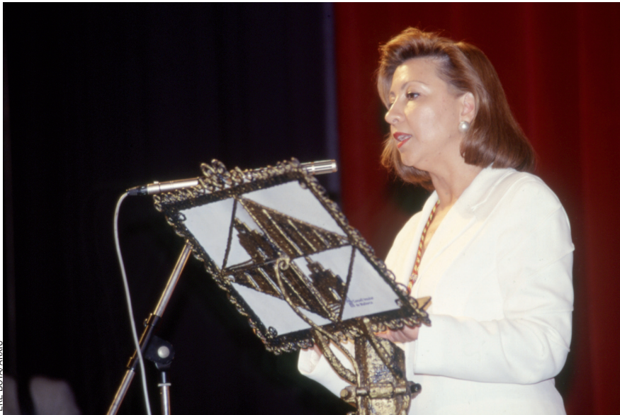
Munar i Unió Mallorquina s'inventaren la Diada per la projecció política pròpia; amb Munar retirada i UM desapareguda, la Diada es va esvaïnt.

vadora Maria Salom, ha eliminat els ministrils.