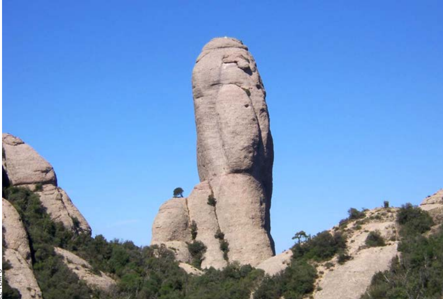
El mal anomenat Cavall Bernat de la muntanya de Montserrat. On és el cavall? Com se sap, el terme cavall és un eufemisme de carall.

ELS sinònims de vulva s'han eixamplat fins al centenar i els de penis han crescut fins a superar els cent trenta. El filòleg Pep Vila (Celrà, Gironès, 1952) ha publicat, en un únic volum, una edició actualitzada i augmentada del seu Bocavulvari eròtic de la llengua catalana , aparegut per primera vegada, en dues parts, els anys 1987 i 1990, sota dos segells editorials diferents, el Llamp i la Magrana.