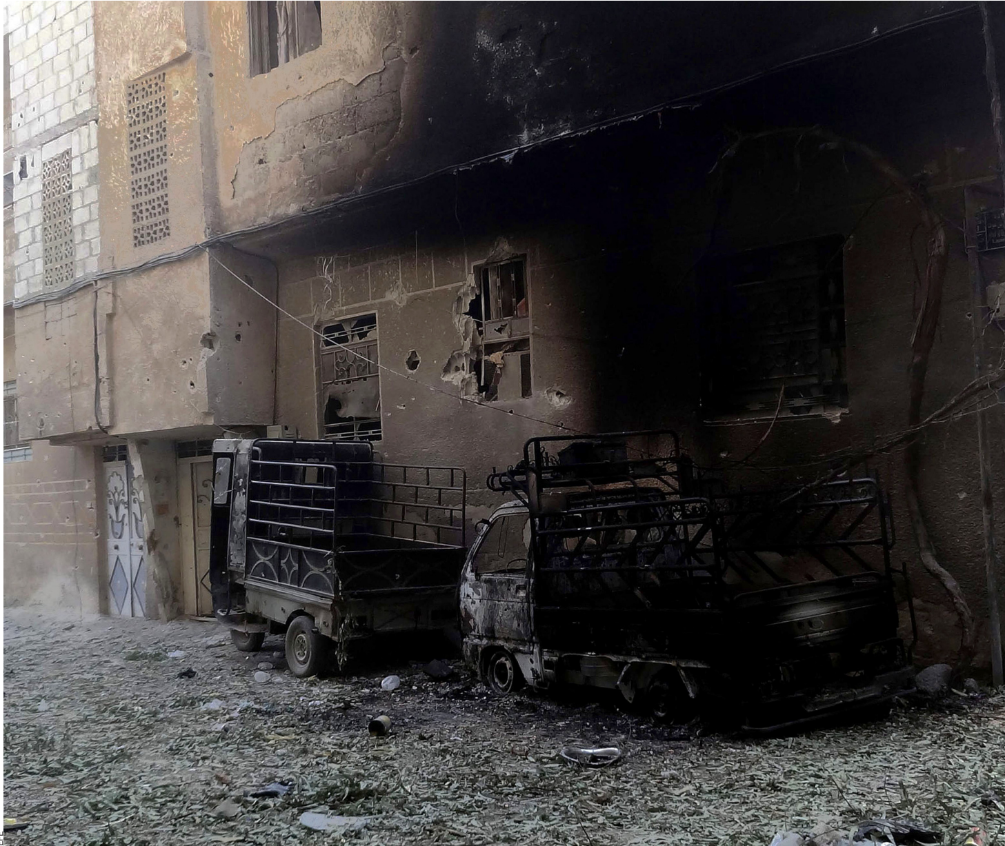
Soldats sirians durant un patrullatge, al sud de Damasc. L'exèrcit continua el procés d'aclarida d'insurgents.