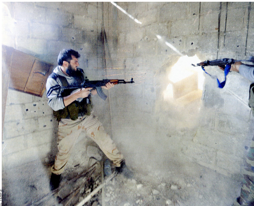
Mentre les forces rebels s'enfronten a les tropes siries al suburbi de Mleha, la ciutat vella de moment s'ha mostrat en bona part immune a la violència.

negre i amb corbata del mateix color. Té la boca estreta i un bigotí ros. Al novembre, un destacament rebel va disparar i matar el seu germà quan anava de camí a la feina.