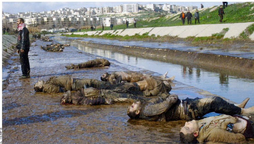
L'Exèrcit Lliure de Síria i activistes de l'oposició van trobar un total de 108 cadàvers lligats de mans i amb impactes de bala al cap, al riu, a Alep, probables víctimes d'una execució sumària.

"Aquest aixecament és principalment organitzat i finançat des de l'estranger", afirma el vice-ministre d'Afers estrangers Faisal al-Mikdad. Ha viatjat molt