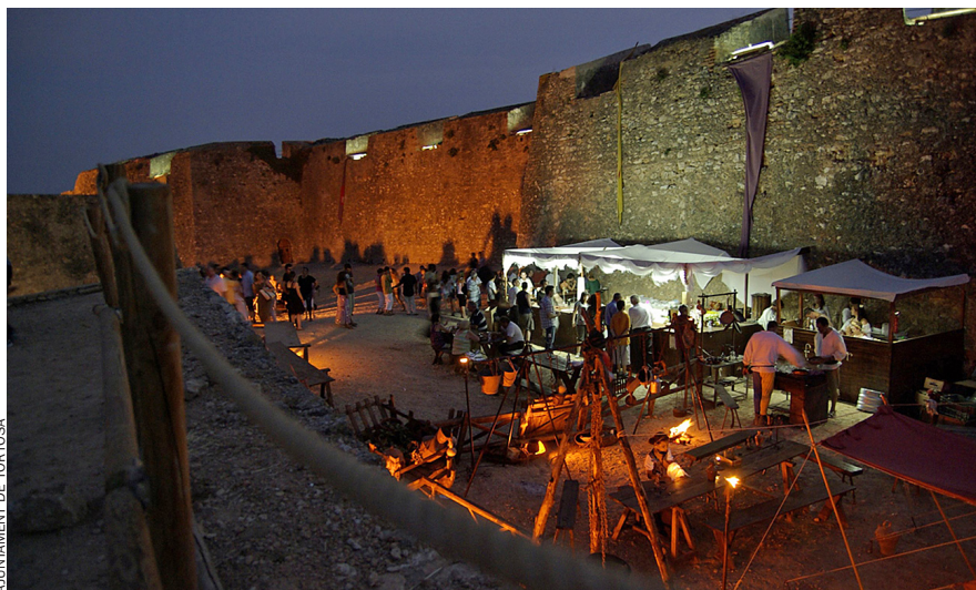
AJUNTAMENT DE TORTOSA