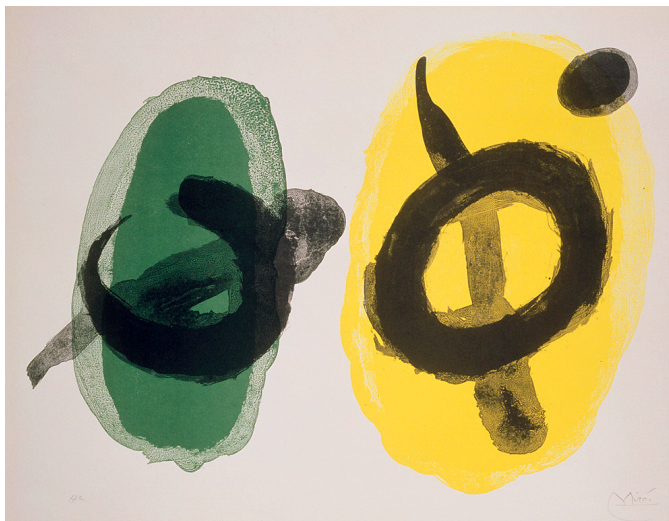
Sèrie III, 1952-1953, aiguafort i aiguatinta. Groc i verd, 1961, litografia.

Leiris a Bagatelles végétales (1956) i Paul Éluard, a A toute épreuve amb 80 xilografies realitzades en fusta de boix.