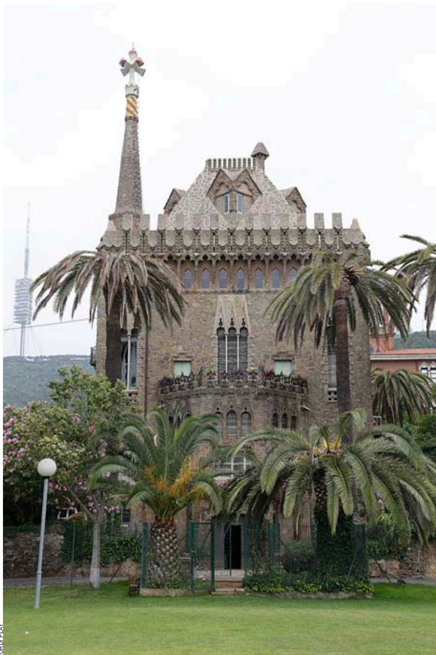
Bellesguard es presentarà el 17 de setembre, amb l'assistència del conseller de Cultura, Ferran Mascarell, i l'alcalde de Barcelona, Xavier Trias. L'endemà mateix començaran les visites guiades.

encara els seus grans projectes, i, políticament, s'acosta més que mai al que avui entendríem per independentisme" (vegeu pàgines 28, 29).