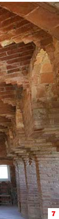
1. El llum de la sala dels Maons és la corona del Rei Martí a l'inrevés. 2. Banc del jardí: a l'esquerra la Corona d'Aragó, amb la corona reial i les quatre barres; a la dreta, l'escut del Casal de Barcelona i la corona comtal. 3. Onades o nervis d'una fulla als sostres 4. En ferro forjat: Ave Maria Puríssima sens peccat fou concebuda 5. Les cavallerisses 6. El lleó i el gall com a motius de la ceràmica vénen de l'escut d'armes de Margarida de Prades, que es casà amb Martí l'Humà a Bellesguard 7. La impressionant ala dels Maons, destinada a la música. 8. L'estrella de Venus. 9. Les inicials de Jaume Figueres, amic de Gaudí que compra Bellesguard poc abans de morir