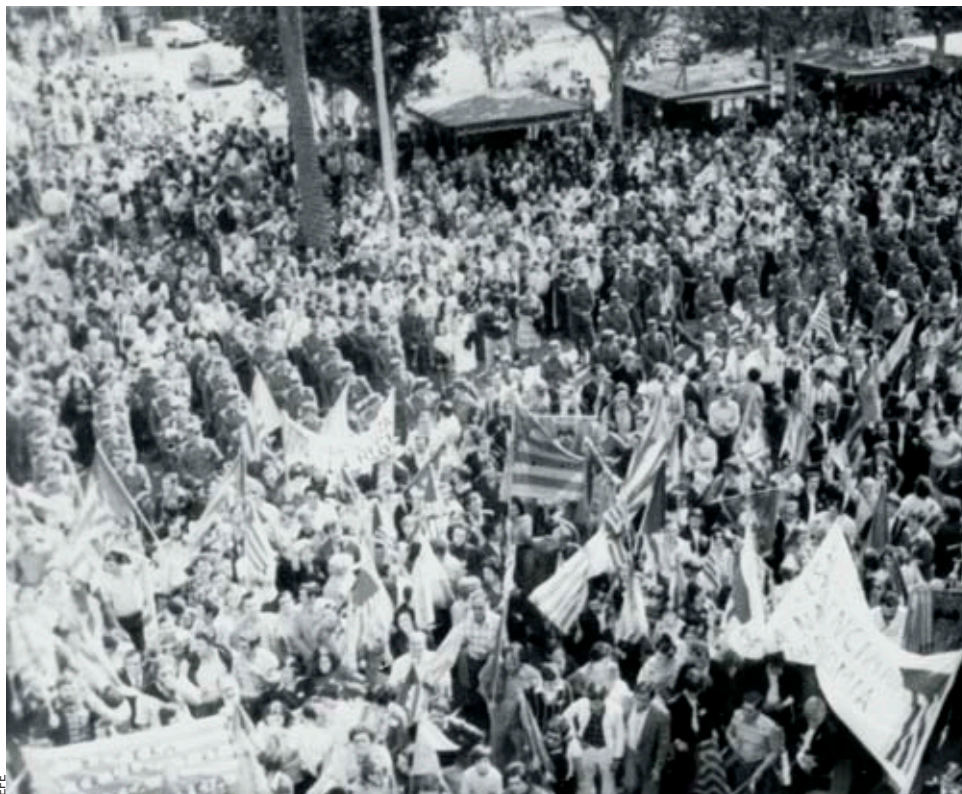
Multitudinària manifestació del 9 d'octubre del 1977 a València. Al costat, Josep Tarradellas amb

El panorama autonòmic concebut a la Transició va néixer ple de renúncies forçades per la pressió del moment o la feblesa d'alguns actors. Aquest començament, que es podia haver corregit amb el temps, ha esdevingut un llast que no resol l'encaix dels territoris de parla catalana. Repassem cada cas en concret.