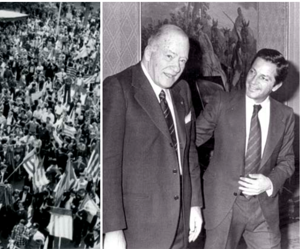
Adolfo Suárez en una de les reunions prèvies a la restitució de la Generalitat de Catalunya.