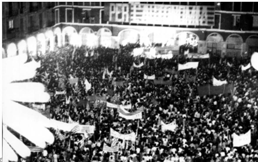
Manifestació del 29 d'octubre de 1977 a la plaça Major de Palma a favor de l'autonomia. L'entitat convocant era l'Obra Cultural Balear.

No obstant, grups nacionalistes com el PSAN, Unió Autonomista i el PSI –el qual seria a partir de 1977 el PSM–, així com partits d'esquerra, talment el Moviment Comunista i el PCE, començaren durant aquell 1976 a desmarcar-se de la resta de formacions opositores i a exigir que les Illes tinguessin un Estatut d'autonomia abans de la futura Constitució. Aquest anhel es va fer més intens el 1977. La pressió nacionalista va provocar que totes les formacions polítiques signessin just abans de les primeres eleccions, les del 15 de juny, el Pacte Autonòmic: es comprometien que els diputats i senadors que sortissin elegits reclamarien junts i immediatament, fossin del partit que fossin, un estatut d'autonomia al govern de Madrid. Però a l'hora de la veritat, UCD, PSOE i AP –que foren els que aconseguiren els escons– s'oblidaren del que havien signat. Els nacionalistes del PSI, i també el PCE, intentaren forçar-los a recuperar el consens autonòmic. Fins i tot l'Obra Cultural Balear va organitzar el 29