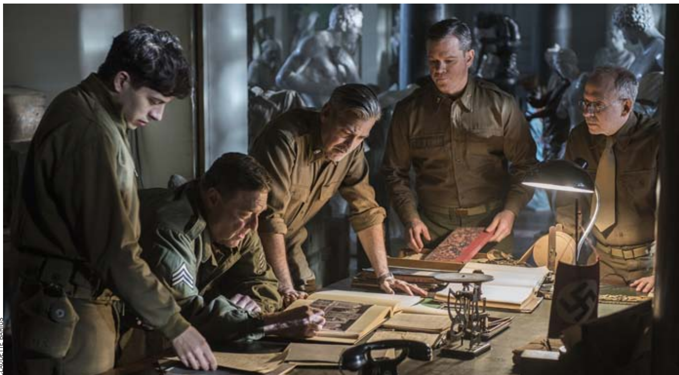
Escena de The Monuments Men , de George Clooney. Els veritables Monuments Men van interrogar Gurlitt el 1945.

part de la seva col·lecció en un antic molí d'aigua, material que després va recuperar.