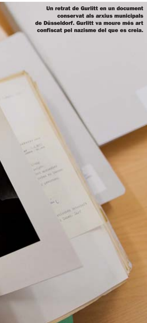
Un retrat de Gurlitt en un document conservat als arxius municipals de Düsseldorf. Gurlitt va moure més art confiscat pel nazisme del que es creia.

En un estrany gir dels esdeveniments, mesos després de la guerra, el castell d'Aschbach albergava un grup de joves