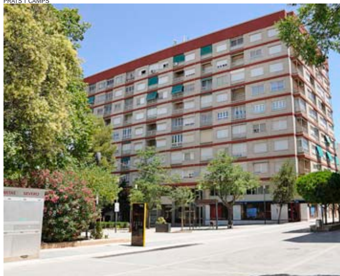
Pérez de los Cobos durant el seu discurs del Dia de la Constitució, l'any 2005, a Iecla. A l'esquerra, el parc de Las Palomas amb l'edifici on va passar

xer Francisco Pérez de los Cobos, el discutit president del Tribunal Constitucional (TC).