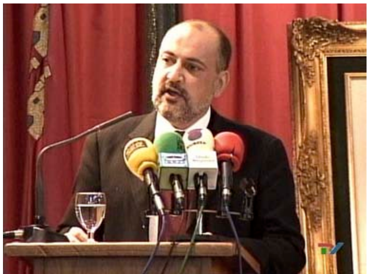
PRATS I CAMPS