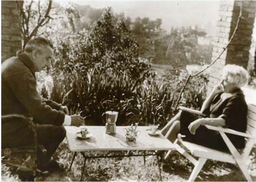
A dalt, Joan Sales i Mercè Rodoreda, dos dels més il·lustres representants de l'exili literari català. Baix, Josep Renau i Manuela Ballester en una imatge presa a Ciutat de Mèxic, el 1954.