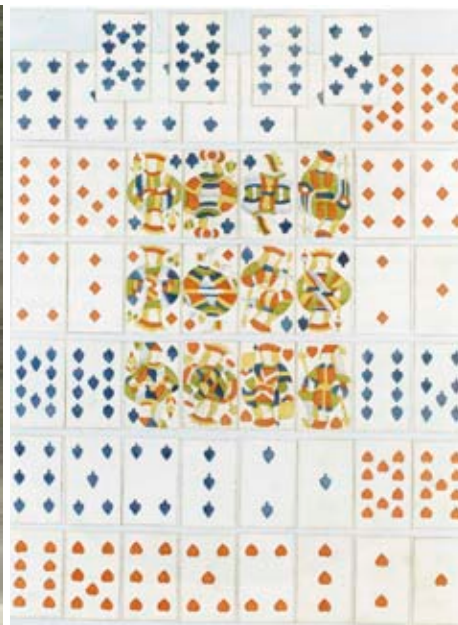
Retrat del rei Felip V el 1701; cal·ligrama funerari per la mort de Carles II l'any 1700, i baralla de 52 cartes, un joc molt popular a Barcelona.

En l'àmbit de la guerra s'hi exhibeixen alguns retrats dels millors generals europeus que van combatre en aquest front de guerra i plànols dels enfrontaments militars més decisius del moment, com el setge de Lleida, el 1707, o bé la batalla d'Almenar, tres anys després. Evidentment, no hi falta el setge de Barcelona de 1713-1714, del qual es conserva una sèrie de gravats de Jacques Rigaud que mostra diferents fases de l'assalt de les tropes borbòniques contra les muralles de Barcelona que va acabar l'11 de setembre.