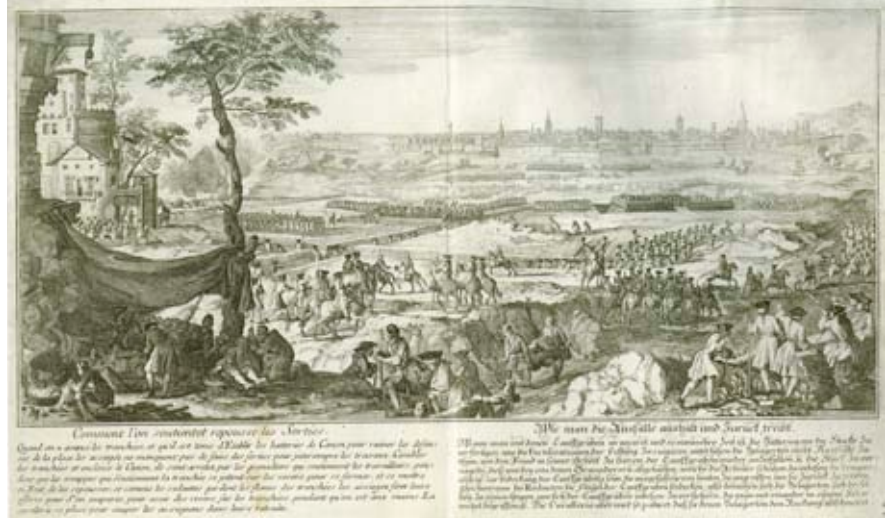
Dalt, vista de la Lleida ocupada cap al 1717 del gravador Gabriel Bodenehr. A sota, les trinxeres construïdes pels Borbó a Barcelona per col·locar explosius a les muralles de la ciutat el 1713.

tipus que es coneix al món. Es va fer a València, i és l’únic que s’exposa produït en territori peninsular. És una peça molt significativa, que presenta un jove Felip V amb la mà dreta sobre la corona reial i deixant entreveure per sobre de la capa l’espasa cerimonial i el Toisó d’Or, un símbol de poder que la branca borbònica es va fer seu”, explica Gelonch, que afegeix que “probablement el gravador valencià no va veure el rei abans de dibuixar-lo, perquè va vestit com un Habsburg i no com un Borbó”.