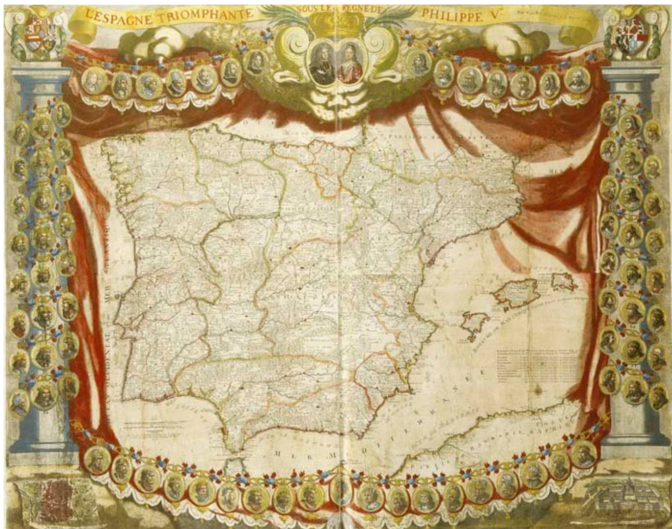
'L'Espanya triomfant sota el regnat de Felip V' de Nicolas de Fer (París, 1705), no inclou ni els comtes de Barcelona ni els reis d'Aragó i de Navarra.

U n conflicte dinàstic que provoca una guerra cruenta i una societat atònita que veu escapçada la seva vida quotidiana. La Catalunya de principis del segle XVIII, dividida en vegueries i sots-vegueries que es corresponien amb prou exactitud amb els antics comtats i vescomtats d'origen medieval, tenia una població d'uns 400.000 habitants. Barcelona era, de llarg, la ciutat més gran del país, però també eren nuclis importants Tarragona, Tortosa, Lleida, situada en el camí reial que unia Barcelona amb Madrid, i Girona, avantsala de la frontera francesa.