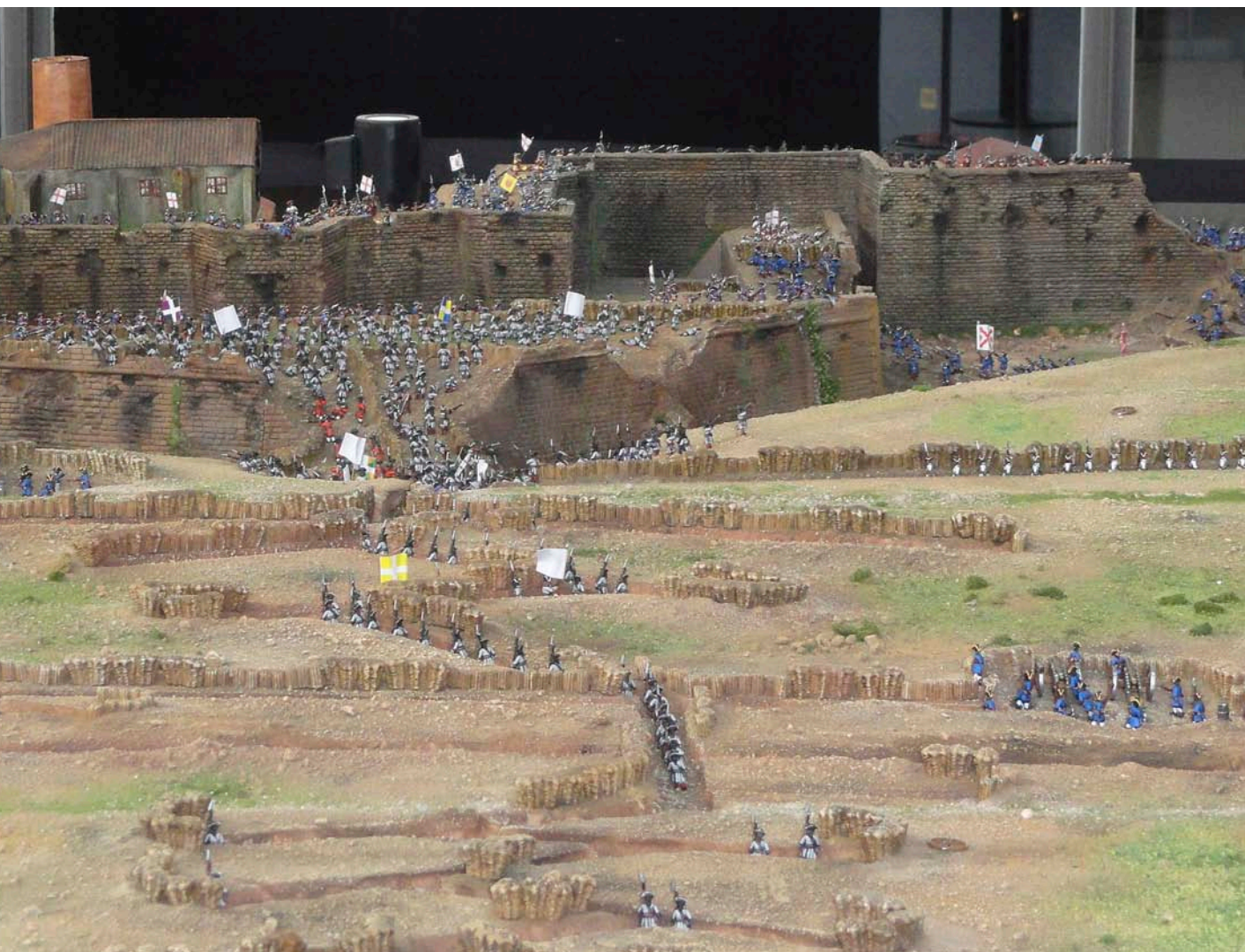
mostra les trinxeres del camp borbònic i el baluard de Santa Clara, on es lliura una gran batalla.

cidir posar tota la carn a la graella i mobilitzar el gros de l'exèrcit francès contra Catalunya. La primera cosa que va fer va ser enviar a Barcelona el duc de Berwick, que el 6 de juliol de 1714 va arribar a la ciutat amb quaranta mil soldats. El nou comandant va despatxar Pòpuli i va canviar d'estratègia. En comptes de concentrar els esforços a prendre la fortalesa de Montjuïc, Berwick va decidir que la millor manera de prendre la ciutat era atacant les muralles de llevant.