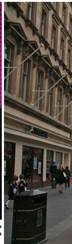
1 A dalt, l'últim debat televisat sobre la independència entre Allister Darling (esquerra) i Alex Salmond. 2 Glasgow és la ciutat més poblada. A l'època colonial es coneixia com "la segona ciutat de l'imperi". 3 Les carreteres escoceses no són les millors del món: les vies d'un sol carril amb llocs per deixar pas ( passing Place ) són habituals als Highlands. 4 Tomba d'un mite escocès: Rob Roy.