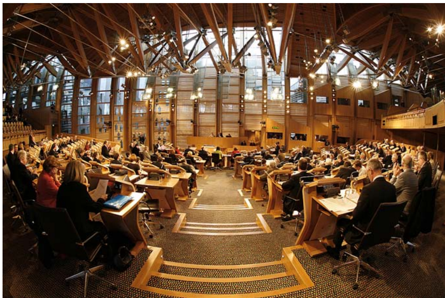
A l'esquerra, una foto del castell del Ilac Awe. A dalt, el Parlament escocès, obra de l'arquitecte català Enric Miralles. A sota, el centre d'interpretació de la batalla de Culloden.