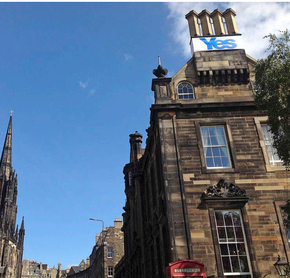
La dreta un cartell favorable al sí a la independència en un carrer de la capital escocesa.

que l'independentista Salmond havia arrasat en el joc.