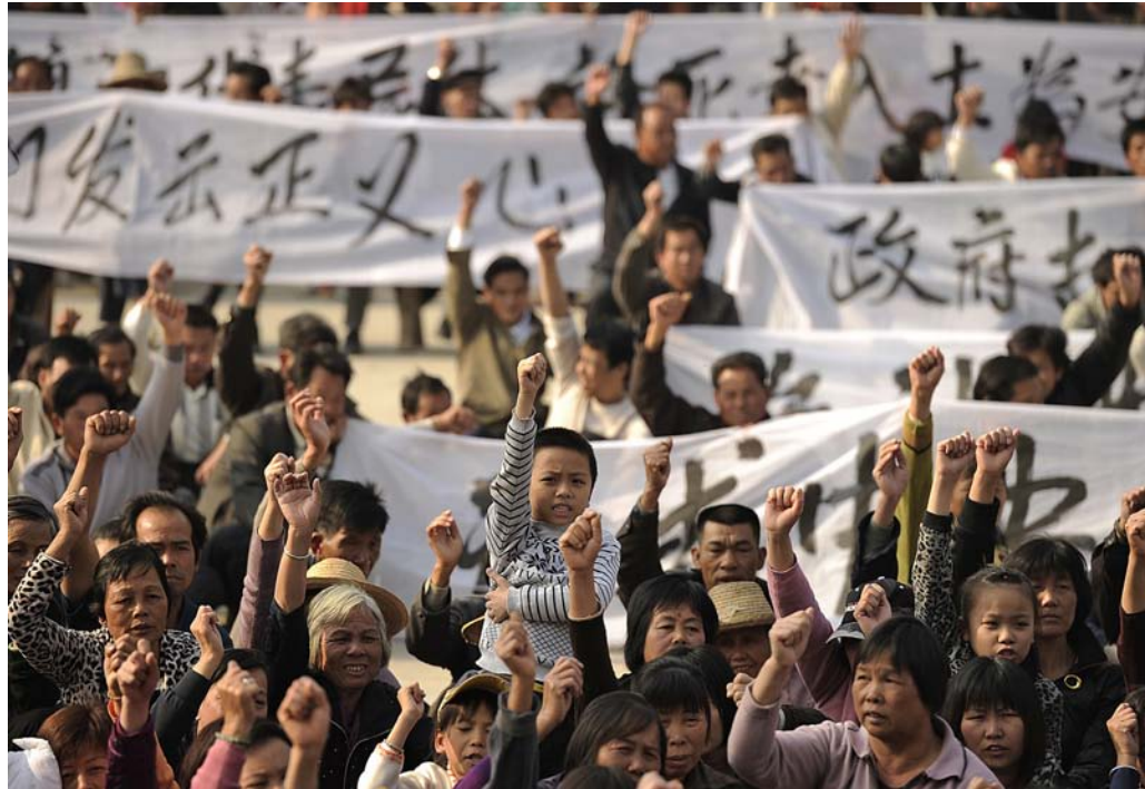
Les protestes d'estudiants de Hong Kong per la democràcia no són la primera revolta popular en aquest sentit, fa tres anys a Wukan (a la foto) ja es van preguntar si la Xina podria ser democràtica.

Tres anys abans de les protestes a Hong Kong, els habitants del petit poble de Wukan van celebrar eleccions lliures.