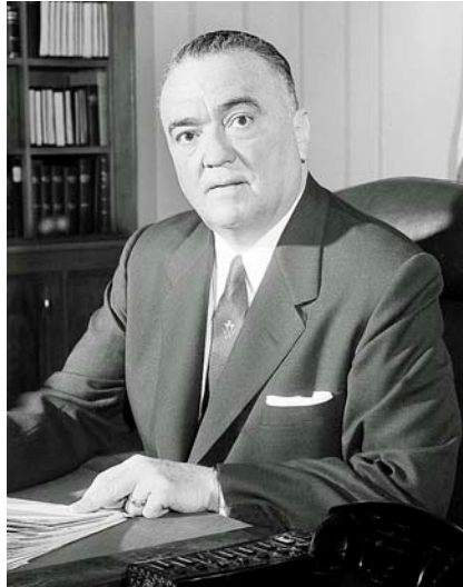
J. Edgard Hoover, enemic declarat de Martin Luther King.

Un coneixement de la seua vida íntima que acrediten amb una cita d'àudio que acompanya la carta. Comportaments que en el termini de 34 dies es faran públics a la nació, s'afirma en un inquietant darrer paràgraf que conté també una pertorbadora apel·lació: "Només li resta a vostè una cosa per fer. I vostè sap el que és". Dues frases que, amb bastant legitimitat, s'han interpretat com una incitació al suïcidi de King davant la imminent destrucció de