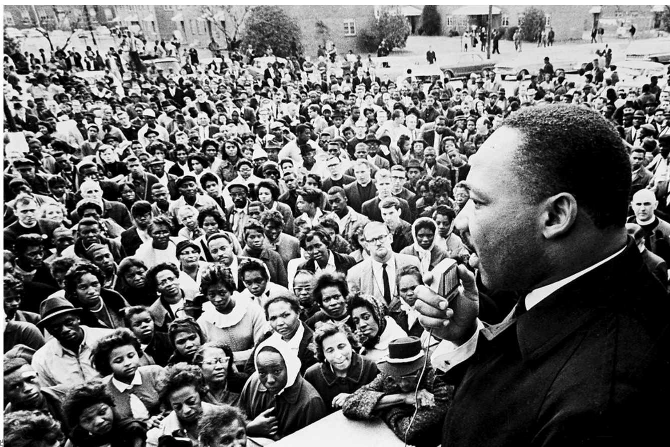
Martin Luther King en un acte a Selma, Alabama, el 13 de març del 1965.